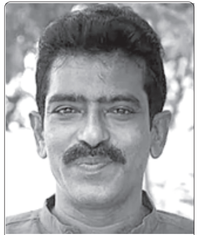
రచయిత సిపిఐ(ఎం) రాష్ట్ర కమిటీ సభ్యులు, మహా విశాఖ నగర పాలక సంస్థ కార్పొరేటర్.