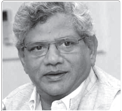
రచయిత భారతయ కమ్యూనిస్టు పార్టీ (మార్క్సిస్టు) మాజీ ప్రధాన కార్యదర్శి. 2005 నవంబరు 3న ఆయన రాసిన వ్యాసాన్ని మార్క్సిస్టు పాఠకులకు అందిస్తున్నాం.

వర్గ ఆదివత్సం దృష్ట్యా చూస్తే ప్రపంచీకరణ సంస్కృతి ప్రజలను తమ రోజువారీ వాస్తవికతల నుండి దూరం చేస్తుంది. సంస్కృతి ఇక్కడ సౌందర్యశాస్త్రానికి దన్నుగా నిలబడదు. పేదరికం, దౌర్భాగ్యం వంటి తక్షణ సమస్యల నుండి పక్కదోప పట్టించడానికి వినియోగించబడుతుంది.