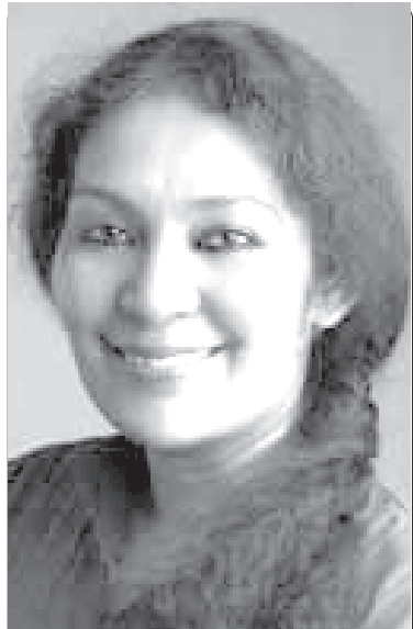
రచయిత ఢిల్లీ కేంద్రంగా పని చేస్తున్న జర్నలిస్టు. రాజకీయాలు, అస్థిత్య ఉద్యమాల మీద ఇప్పటివరకు నాలుగు పుస్తకాలు వెలువరించారు

అనుగుణమైన చట్టాల రూపకల్పన కోసం వీళ్ళు రాజకీయాల్లో చేరుతున్నారు. ఇది నైతికంగా, సామాజికంగా పెద్ద తప్పు, అయినా జరుగుతున్నది. తాజాగా మహారాష్ట్ర రాజకీయాలు ఇందుకు ఒక ఉదాహరణ. మహారాష్ట్ర ఎన్నికల సందర్భంగా ముంబైలో చేసిన స్వల్పకాలిక పర్యటన ఎన్నికల ప్రచారసరళి మీద మాకు విహంగ వీక్షణ అవగాహన కల్పించింది. ఈ మహానగరంలోని ప్రజలు తమ అభ్యర్థులకు ఉన్న రియల్ ఎస్టేట్ వ్యాపారాల గురించో, లేక ఆ వ్యాపారులతో ఉన్న సంబంధాల గురించో చర్చించుకోవడం కనబడింది. ఫలానా రియల్ ఎస్టేట్-కమ్-రాజకీయవేత్త అయిన X ని అతని ప్రత్యర్థి Y కాల్చి పారేసే అవకాశం ఉందనో, లేదా ఫలానా Y, Z అభ్యర్థులకు వింత బలమైన రియల్ ఎస్టేట్ లాభి వెన్నూ