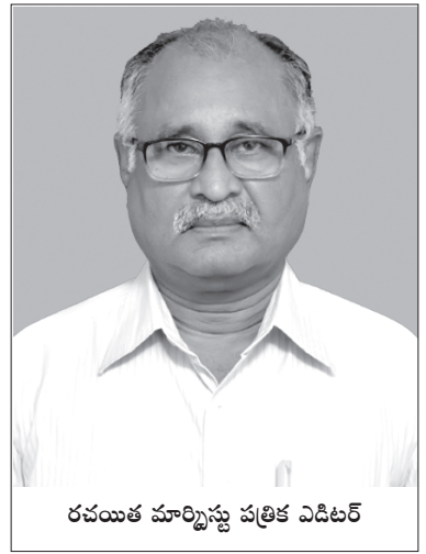
రచయిత మార్క్సిస్టు పత్రిక ఎడిటర్

(2023 డిసెంబర్ 23-25 తేదీల్లో విజయవాడలో జరిగిన సైన్సు వర్క్‌షాపులో ప్రవేశపెట్టిన పత్రం నుండి)