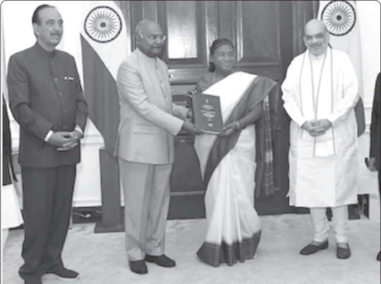
రాష్ట్రపతి ద్రౌపది ముర్ముకు జమిలి ఎన్నికల సిఫార్సులను అందజేస్తున్న మాజీ రాష్ట్రపతి రామ్ నాథ్ కోవింద్

“ఆంధ్రప్రదేశ్ లో అధికారంలోకి వచ్చిన తర్వాత చంద్రబాబు నాయుడు గారు బడా పెట్టుబడిదారులకు అంతులేని లాభాలను, సంపదలను కట్టబెట్టటానికి పూనుకున్నాడు. ఎన్నికలలో ప్రజలు ఓడించిన జగన్ విధానాలను సాకుగా చూపుతూ ప్రజలపై కనీవీనీ ఎరుగని భారాలను మోపు తున్నాడు. ”