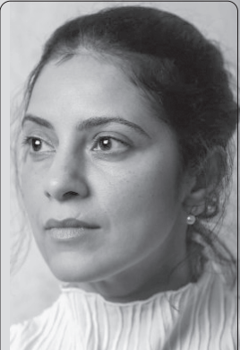
రచయిత ఆక్స్ ఫర్డ్ యూనివర్సిటీలోని రాయిటర్స్ ఇన్స్టిట్యూట్లో జర్నలిజం కోర్సు డైరెక్టరు. ప్రింట్, డిజిటల్, టీవీ జర్నలిజంలో రెండు దశాబ్దాల అనుభవం గల రాజకీయ, ఆర్థిక విశ్లేషకురాలు)

సంపన్నవర్గాలు - రామమందిరం ఈ మధ్యకాలంలో చోటు చేసుకున్న రెండు ప్రధాన ఘట్టాలు కార్పొరేట్ సంస్థాధిపతుల వైఖరికి అద్దం పడుతున్నాయి. అయోధ్యలో రామమందిర ప్రారంభోత్సవ సంబరం మొదటిది. ఈ ప్రారంభోత్సవ కార్యక్రమాన్ని ప్రత్యక్ష ప్రసారాల్లో తిలకించిన వారందరికీ భారత కార్పొరేట్ సంస్థాధిపతులు అందరినీ ఒకచోట చూసే అవకాశం దక్కింది. రిలయన్స్ సంస్థల అధిపతి అంబానీ నుండి ఉక్కు పరిశ్రమాధిపతి లక్ష్మీ మిట్టల్ వరకూ అందరూ హాజరు వేయించు