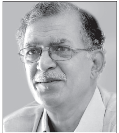
రచయిత ప్రజాశక్తి మాజీ సంపాదకుడు

క్రీ.శ. 800 - 1200 మధ్య కాలంలో చేతివృత్తులు, ముఖ్యంగా చేనేత ఉన్నత ప్రమాణాలతో కొనసాగింది. బంగారు, వెండి ఆభరణాల తయారీలో కూడా అటువంటి పరిస్థితే ఉంది. వ్యవసాయాభివృద్ధి సైతం కొనసాగింది. ఈ ఉపఖండపు భూములు సారవంతమైనవని, రైతులు నైపుణ్యం కలిగివున్నారని ఇక్కడ ఆ కాలంలో పర్యటించిన అరబ్బు యాత్రికులు తమ గ్రంథాల్లో పేర్కొన్నారు.