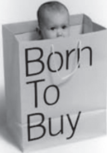
పెట్టుబడిదారీ సంస్కృతి చిరికి మనందరికీ మిగిల్చే ఒకే ఒక అస్తిత్వం...ఎనియోగదారుడు

అమెరికా తన ఆధిపత్యాన్ని రుద్దడానికి సాంస్కృతిక రంగం మీద కూడా పెద్ద ఎత్తున దాడికి తెగబడుతుంది. క్లింటన్ అధికార యంత్రాంగంలో పని చేసిన కొలంబియా విశ్వవిద్యాలయ ఆచార్యులు డేవిడ్ రోట్కోఫ్ అమెరికన్ పాలకుల ఉద్దేశాలను ఎంత చక్కగా వివరించాడో చూడండి -