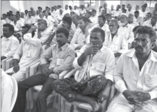
2013 జూలైలో విజయవాడలో కృష్ణాజిల్లా కౌలు రైతుల సదస్సు.

“ చట్ట ప్రకారం రెవెన్యూ, వ్యవసాయ అధికారులు నేరుగా కౌలుదార్ల వద్దకు వెళ్ళి, వారిని గుర్తించి, రుణ అర్హత కార్డులు మంజూరు చేయాలి. భూ యజమానుల ప్రమేయం లేకుండా కార్డులు ఇవ్వాలి. కాని వీరు భూ యజమానుల దగ్గర పాస్ పుస్తకాలు తేవాలనీ, వారి అనుమతి కావాలనీ కౌలు దారులకు చెబుతూ మోకా లడ్డుతున్నారు. ”