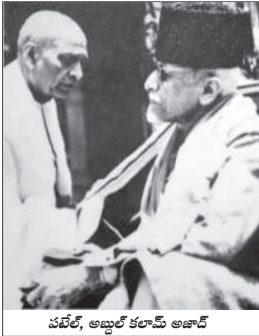
పటేల్, అబ్దుల్ కలామ్ అజాద్

1948 మార్చి 4న మంత్రివర్గ నిర్ణయా లపై పటేల్ కు నెహ్రూ ఒక లేఖ రాస్తూ, “ఢిల్లీలో ప్రస్తుతం ముస్లింలు ఎక్కువగా నివసిస్తున్న ప్రాంతాలను ముస్లిం శరణార్థుల కోసం రిజర్వు చేయాలని రెండు మూడు నెలల క్రితం మనం నిర్ణయానికి వచ్చిన విషయం మీకు గుర్తుండే సాంటుంది” అని చెప్పారు. (పై పుస్తకం