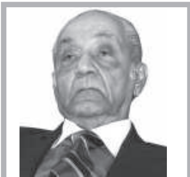
రచయిత 1930 సెప్టెంబర్ 16 జన్మించారు. న్యాయవాదిగా, చరిత్రకారునిగా, రచయితగా గుర్తింపు పొందారు. బొంబాయి హైకోర్టు న్యాయవాదిగా, సుప్రీం కోర్టు న్యాయవాదిగా పనిచేశారు. భారత దేశంలో ప్రసిద్ధిగాంచిన రాజ్యాంగ నిపుణుల్లో ఆయన ఒకరు.

తక్కువగా చెబితే అంత మంచిది. ఆయన ఈ మాటలు చెప్పడానికి ఎంతమాత్రం అర్హుడు కాదు. ముంబయిలో కేవలం హిందువులకు మాత్రమే అనుమతిచ్చే ఈత కొలనును వల్లభ్ భాయ్ పటేల్ ప్రారంభించలేదా? సముద్రపు నీటిని కూడా పంచుకోడానికి ముస్లిం సోదరులకు అనుమతిలేని ఈత కొలను ప్రారంభోత్సవంలో పటేల్ పాల్గొనడాన్ని నిరసిస్తూ కొంతమంది యువకులు ప్రదర్శన చేసిన విషయం ఆయన మరిచిపోయారా?” (ది నేషన్స్ వాయిస్, వాల్యూమ్ 4, 1947..ఎడిటర్