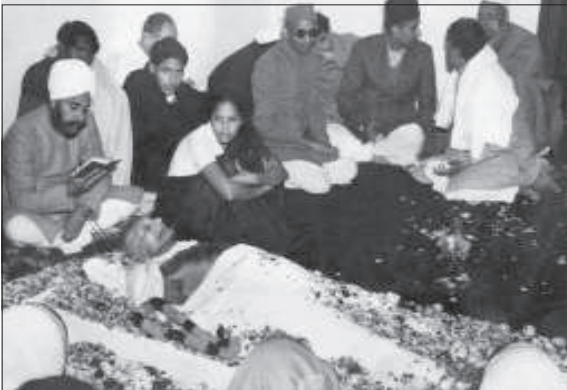
మతతత్వ వాదిగా శాండకపోవడమే మహాత్మాని నేరం : ఆర్ఎస్ఎస్ శక్తుల తూటాలకు బలైన గాంధీ పుత్రదేహం

“ 1948 జనవరి 6న పటేల్ ఒకవైపు అజాద్ దేశభక్తిని ప్రశ్నిస్తూ, హిందూమహాసభ, ఆర్ఎస్ఎస్ వాళ్లను కాంగ్రెస్లో చేరాలని ఆహ్వానించారు. పచ్చి మతతత్వ వాదులు మాత్రమే ఆ పని చేయ గలరు. ఆయన ఇలా అన్నారు: “నేను భారతీయ ముస్లింలను ఒకే ప్రశ్న వేస్తున్నాను. ఇటీవల జరిగిన అఖిలభారత ముస్లిం కాన్ఫరెన్స్లో మీరు కాశ్మీర్ పై ఎందుకు నోరు మెదప లేదు? పాకిస్తాన్ చర్యలను ఎందుకు ఖండించలేదు? ఇవన్నీ ప్రజల మనసుల్లో నందేహాలు లేవనెత్తుతున్నాయి. ”