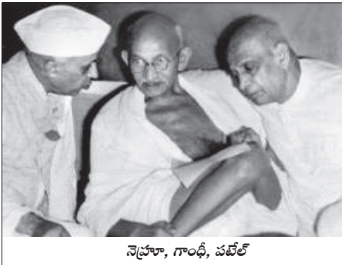
నెహ్రూ, గాంధీ, పటేల్

నరేంద్ర మోడీ ఒకప్పుడు అద్వానీ శిష్యుడు. ప్రధాని అభ్యర్థి పదవికి జరిగిన పోటీలో ఆయనను గద్దెనుండి దించేసినప్పటికీ ఆయన పంథాను మాత్రం ఇంకా తీవ్రంగా అనుసరిస్తున్నారు. ఆయన మాటలు చదవండి: “దేశమూ, హిందు