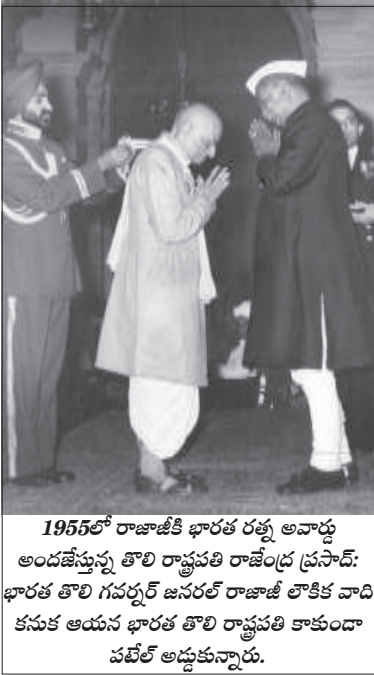
1955లో రాజాజీకి భారత రత్న అవార్డు అందజేస్తున్న తొలి రాష్ట్రపతి రాజేంద్ర ప్రసాద్. భారత తొలి గవర్నర్ జనరల్ రాజాజీ లౌకిక వాది కనుక ఆయన భారత తొలి రాష్ట్రపతి కాకుండా పటేల్ అడ్డుకున్నారు.

“తరువాత పటేల్ వి.పి మీనన్ ను కలిసి, సంభాషించి వైస్రాయ్ ని చూడానికి వచ్చారు. మౌంట్ బాటన్ తో ఆయన ఇలా చెప్పారు: “మీరు చెప్పింది అంగీకరించడానికి నేను సిద్ధమే. అయితే మీరు నాకు ‘ఒక గంపనిండా ఆపిల్ పళ్లు ఇవ్వాలి’ అన్నారు. అంటే ఏమిటి అర్థం? అని లార్డ్ మౌంట్ బాటన్ అడిగారు. “నేను 565 పళ్లు - మొత్తం సంస్థానాల సంఖ్య- శాన్న్ ఆపిల్ బుట్టకొంటాను. కానీ అందులో రెండు లేక మూడు పళ్లు తగ్గినా కొనను అని పటేల్ అన్నారు. “దీన్ని నేను పూర్తిగా ఒప్పుకోను. కానీ నా శాయశక్తులా ప్రయత్నిస్తాను” అని మౌంట్ బాటన్ అన్నారు. ఒకవేళ బుట్టలో 560 శాంటే మీరు కొంటారా? అని మౌంట్ బాటన్ అంటే, ‘కొనొచ్చు’ అని పటేల్ సమాధానం