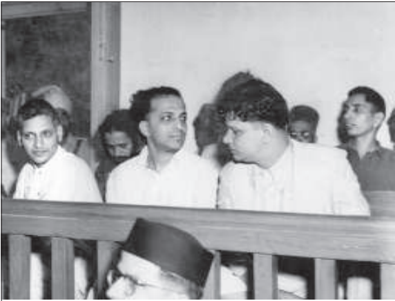
మహాత్మాగాంధీ హత్య విచారణ సందర్భంగా కోర్టులో (ఎడమనుండి కుడికి వరుసగా) నాభూరామ్ వినాయక్ గాడ్సే, నారాయణ దత్తాత్రేయ ఆప్టె, విష్ణు రామకృష్ణ కర్కరే.

“రాప ప్రధాన మంత్రిగా, హోమ్ మంత్రిగా పటేల్ కాశ్మీర్ మహారాజును సమర్పించేవారు. మహారాజుకు వ్యతిరేకంగా పోరాడుతున్న ప్రజా నాయకుడైన షేక్ అబ్దుల్లానూ, ప్రజా ట్రిబ్యునళ్లనూ వ్యతిరేకించేవారు. భారత యూనియన్ లో కలిసిపోదానికి కాశ్మీర్ మహారాజును ఒప్పించేందుకు ప్రయత్నించేవారు. చివరికి 1948 జనవరి 31వ తేదీన కాశ్మీర్ రాజు తన స్వతంత్ర దేశంగా విడిపోతానని బెదిరించినప్పటికీ పటేల్ ఆయన పట్ల సానుకూలంగానే సాండేవారు.”