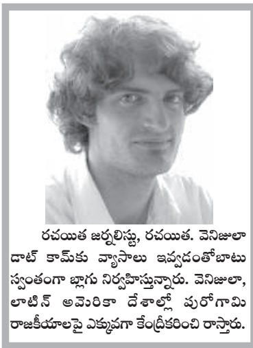
రచయిత జర్నలిస్టు, రచయిత. వెనిజులా డాట్ కామ్ కు వ్యాసాలు ఇవ్వడంతోబాటు స్వంతంగా బ్లాగు నిర్వహిస్తున్నారు. వెనిజులా, లాటిన్ అమెరికా దేశాల్లో పురోగామి రాజకీయాలపై ఎక్కువగా కేంద్రీకరించి రాస్తారు.

సంపూర్ణ లేదా “పరిపూర్ణ కమ్యూనిటీ వైద్య విధానం” అనేది 2005లో వెనిజులా అధ్యక్షుడు హ్యూగో ఛావెజ్, క్యూబా అధ్యక్షుడు ఫైడెల్ కార్డోస్ మధ్య జరిగిన ఆరోగ్య ఒడంబడికతో ప్రారంభమైంది. ఈ ఒప్పందం కింద క్యూబా 30 వేల మంది వెనిజులా కమ్యూనిటీ డాక్టర్లకు శిక్షణ ఇచ్చి, వెనిజులా ప్రభుత్వ ఆరోగ్య పథకం “బారియో ఎడెంట్రి”, (సమాజంలో ఒక భాగం) కార్యక్రమం నడిపేందుకు తోడ్పడుతుంది. దీనికి