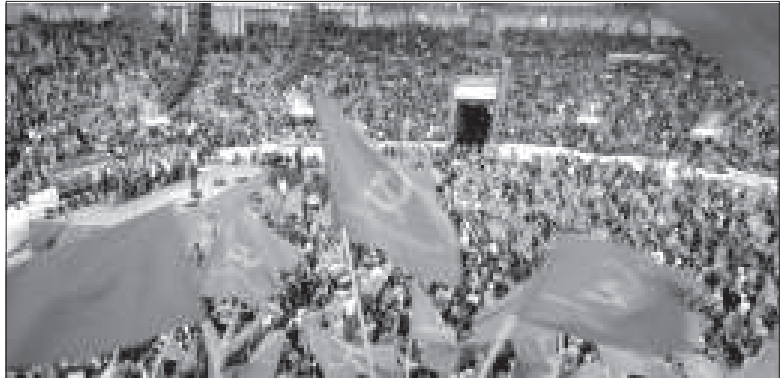
15 అంతర్జాతీయ కమ్యూనిస్టు, వర్కర్స్ పార్టీల సమావేశం ముగింపు సందర్భంగా పోర్చుగీసు కమ్యూనిస్టు పార్టీ ఆధ్వర్యంలో లిస్బన్ నగరంలో జరిగిన ర్యాలీ

“అంతర్జాతీయంగా చోటు చేసుకుంటున్న పరిణామాలను ఆసరాగా తీసుకుని సోషలిజంపై జరుగుతున్న సైద్ధాంతిక దాడి, మీడియా పాత్రమీద ఒక అంతర్జాతీయ స్థాయి చర్చాగోష్టి జరిపే అవకాశాలనూ, ప్రత్యామ్నాయ కమ్యూనికేషన్ నెట్వర్క్ ఏర్పాటు సాధ్యసాధ్యాలనూ పరిశీలించాలని నిర్ణయించింది.”