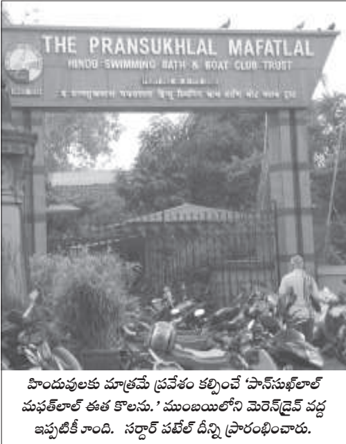
హిందువులకు మాత్రమే ప్రవేశం కల్పించే 'హిందూస్థాన్ లో మతతత్వాల ఈత కొలను.' మంబయిలోని మెరెస్ డైవ్ పద్ద ఇప్పటికీ ఉంది. సర్దార్ పటేల్ దీన్ని ప్రారంభించారు.

“హిందూ జాతీయవాదిగా పేరుపొందిన పటేల్ కు ఆర్ఎస్ఎస్ తో రహస్య, వ్యక్తిగత సంబంధాలూ, ఏర్పాట్లూ ఉండేవి. భారత్, బ్రిటిష్ వ్యాపార ప్రపంచంతో మంచి సంబంధాలుండేవి. అందువల్లనే కాంగ్రెస్ నాయకులు ప్రధానికి కాకుండా ఆయనకు విజ్ఞాపనలు చేసుకుంటుండేవారు..... సనాతన హిందువుగా ఆయన తన మతతత్వ సానుభూతులను కప్పి పుచ్చుకునేవారు కాదు. 99