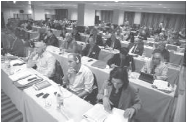
పోర్చుగీసు రాజధాని లిస్బన్ నగరంలో సపంబర్ 8 నుండి 10 వరకు జరిగిన కమ్యూనిస్టు, వర్కర్స్ పార్టీల 15వ అంతర్జాతీయ సమావేశం

చంగా వున్న అంతర్జాతీయ సమాజంలో బహుళ-ధృవ వ్యవస్థ వైపు పరివర్తన చెందుతున్నదనీ వివరించాడు. ఐనప్పటికీ అంతర్జాతీయ పరిణామాలలో (సామ్రాజ్యవాద) ఆధిపత్య ధోరణులు, అధికార, రాజకీయాలూ, నయా-జోక్యందారీ విధానాలూ పెరుగుతున్న సంకేతాలు కొనసాగుతున్నాయి. అంటే సోషలిజం వ్యాప్తికి ఎన్ని అవకాశాలు వున్నాయో, సవాళ్ళూ-అటంకాలూ కూడా వున్నాయని స్పష్టం చేశారు. “ఇవాళ నెలకొన్న అంతర్జాతీయ ద్రవ్య సంక్షోభం పెట్టుబడిదారీ విధానాన్ని ఒక సంస్థాగత డోలాయమాన పరిస్థితుల్లోకి నెట్టేసింది. నయా-దారవాద అభివృద్ధి సమూహా ఇంకెంతో కాలం మనజాలదనీ, తక్షణమే ఏదో ఒక మార్పు, సర్దుబాటు అవసరాన్ని పీకలమీదకి తెచ్చిందనీ” విశదం చేశారు. “కొన్ని పెట్టుబడిదారీ దేశాలు నూతన పారిశ్రామిక విప్లవం మీద ఆధిపత్యం కోసం కీచులాడుకుంటూనే ప్రపంచీకరణ విధానాలను అడ్డం పెట్టుకుని అంతర్జాతీయ నూత్రాలను ఏకపక్షంగా మలచడానికి ప్రయత్నిస్తున్నాయి. సోషలిజం అవకాశాలను తుంచేయడానికి అసమాన పోటీ, అన్యాయమైన చట్టాలు, అపభ్రంశపు ప్రపంచ ఆర్థికవ్యవస్థను అడ్డం పెట్టుకుంటున్నాయని”