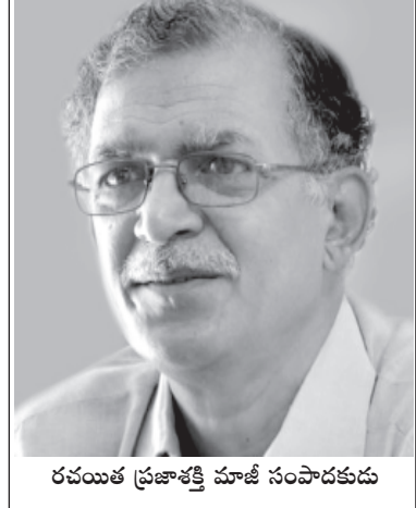
రచయిత ప్రజాశక్తి మాజీ సంపాదకుడు

—త్తరప్రదేశ్, బీహార్ ప్రాంతాలమీద ప్రత్యక్షంగా తమ పాలనను నడిపిన గుప్తుల సామ్రాజ్యం దాదాపు 160 ఏళ్ళ తర్వాత క్షీణించింది. క్రీ.శ.6వ శతాబ్దం నడిమిలో శ్వేత హూణులు ఉత్తర వాయవ్య దిక్కు నుండి వచ్చి కాశ్మీర్, పంజాబ్, పశ్చిమ భారతం ప్రాంతం మీద తమ ఆధిపత్యాన్ని నెలకొల్పగలిగారు. ఇది క్రీ.శ.500 నాటికి సాధ్యమైంది. స్కందగుప్తుడి పాలనా కాలంలో ఈ హూణుల దాడులను విజయవంతంగా ఎదుర్కొన్నప్పటికీ, ఎక్కువ కాలంపాటు గుప్తు సామ్రాజ్యాన్ని కాపాడుకోలేక పోయారు. క్రమంగా ఉత్తర, పశ్చిమ భారతంలోని గుప్తు సామ్రాజ్య భూభాగాలు అంతవరకూ సామంతులుగా వ్యవహరించిన స్థానిక పాలకుల చేతుల్లోకి పోయాయి. అటువంటి సామంతులలో ధానేసర్ (హర్యానా) కేంద్రంగా పాలించిన హర్ష వర్ధనుడు ఒకడు. ఇతడి కాలంలో తక్కిన సామంతులందరినీ లొంగదీసుకుని తన సామ్రాజ్యాన్ని స్థాపించాడు. క్రీ.శ. 606 నుండి 647 వరకూ హర్షవర్ధనుడు పాలించాడు.