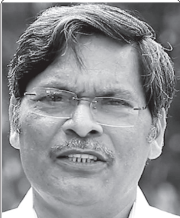
రచయిత సిపిఐ(ఎం) తెలంగాణా రాష్ట్ర కార్యదర్శివర్గ సభ్యుడు

కార్మిక, విద్యార్థి రంగాలకు, గ్రామీణ ప్రాంతాలలో వ్యవసాయ కార్మిక, పేద రైతాంగాలకు ప్రాధాన్యతనివ్వాలని తీర్మానం చెప్పింది. కార్మిక రంగంలో కూడా కీలక, భారీ పరిశ్రమలకు ప్రథమ ప్రాధాన్యతనివ్వాలని, ఆ తర్వాత ఇతర పరిశ్రమలకు ప్రాధాన్యతనివ్వాలని కూడా చెప్పింది. ఇప్పుడు పరిశ్రమలలో, పారిశ్రామిక ప్రాంతాలలో కమ్యూనిస్టు పార్టీ స్థానమేమిటో, ట్రేడ్ యూనియన్లు పరిస్థితి ఏమిటో తెలిసిందే. వ్యవసాయ రంగంలో కృషిని కూడా లోతుగా పరిశీలించవలసిందే. వర్గ పోరాటమే సమాజ మార్పుకు చోదక శక్తి అన్నారు కారల్ మార్క్స్. భారత కమ్యూనిస్టు ఉద్యమంలో ప్రస్తుత పరిస్థితిలో పెట్టుబడిదారులతోనూ, భూస్వాములతోనూ, ధనిక రైతాంగంతోనూ ప్రత్యక్ష ఘర్షణ ఏమేరకున్నదో సమీక్షించుకోవటం అవసరం. పారిశ్రామిక ప్రాంతాలలో యూనియన్ల సంఖ్య తగ్గటం, కాంట్రాక్టు, వలస కార్మికుల సంఖ్య గణనీయమైన స్థాయికి చేరటం దేనిని సూచిస్తున్నది? వ్యవసాయ రంగంలో భూమి కోసం, కూలి కోసం పోరాటం కన్నా ఇతర డిమాండ్లు ముందుకొస్తున్నాయి. పేదరైతులు, కౌలురైతుల సమస్యలకన్నా మధ్యతరగతి, ధనిక రైతుల సమస్యలే ప్రధాన చర్చనీయాంశం అవుతున్నాయి. జాతీయ కార్మికసంఘాల నాయకత్వంలో జరుగుతున్న దేశవ్యాపిత సమ్మెల ప్రభావాన్ని కూడా లోతుగా పరిశీలించటం అవసరం. ఒకప్పుడు యూనియన్లు లేని కంపెనీలు కూడా సమ్మె రోజున మూతపడేవి. క్రమంగా సమ్మె రోజు మూతపడినప్పటికీ