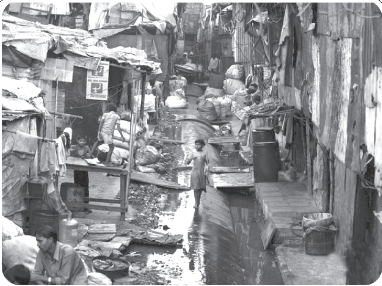
పేదరికాన్ని నిర్మూలించడంలో భారత పాలకులు విఫలమయ్యారు.

“ పేదరికానికి కారణమైన నయా-ఉదారవాద విధానాలను మోడీ మరింత ఉధృతంగా అమలు చేశాడు. ఇది పేదరికాన్ని మరింతగా పెంచింది. వ్యవసాయ రంగాన్ని నీరుగార్చే మూడు నల్ల చట్టాలను తీసుకు రావడానికి మోడీ చేసిన ప్రయత్నం ఈ విధానాల అమలులో పరాకాష్ఠ. రైతాంగం సంఘటితంగా ఆ ప్రయత్నాలను తిప్పికొట్టింది. ”