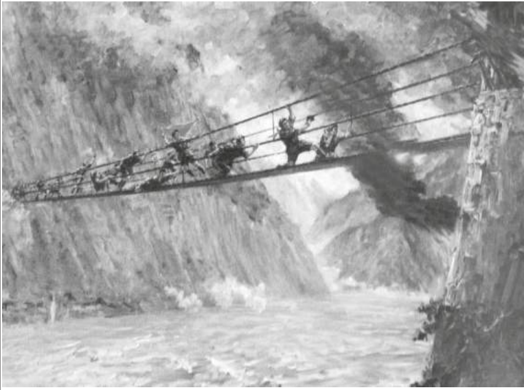
శత్రువు తుపాకీ గుళ్ళు వర్షంకురిపిస్తుండగా టాటూహో నదిని దాటుతున్న రెడార్వీ యోధులు