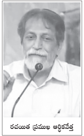
రచయిత ప్రముఖ ఆర్థికవేత్త

“నయా ఉదారవాదం పెట్టుబడిదారీ విధానం” అంటే ఏమిటి? ఇది పెట్టుబడిదారీ విధాన పరిణామంలో ఒకదశ. వివిధదేశాల మధ్య సరుకుల రాకపోకలపైన, పెట్టుబడుల రాకపోకలపైన ఉండే అంక్షలు దాదాపు ఎత్తి వేస్తారు. ద్రవ్యపెట్టుబడి రాకపోకలపై అంక్షలు కూడా పూర్తిగా సడలించబడతాయి. అంతర్జాతీయ ద్రవ్యపెట్టుబడి వత్తిడి వలన ఈ సడలింపు లన్నీ అమలు జరుగుతాయి. అంటే ఈ దశలో పెట్టుబడిదారీ వ్యవస్థ అంతర్జాతీయ ద్రవ్య పెట్టుబడి పెత్తనం కింద నడుస్తుందన్నమాట. వివిధ దేశాలలోని బడా పెట్టుబడిదారులంతా ఈ అంతర్జాతీయ ద్రవ్యపెట్టుబడితో మమేకం అవుతారు. దాంతో అన్నిదేశాలలోనూ ఒకేరకమైన నయా ఉదారవాద విధానాలు అమలులోకి వస్తాయి.