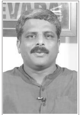
రచయిత విజయవెన్ ఉపాధ్యక్షులు

నవంబర్ 8, 2016 నాడు మోడీ చేసిన ప్రసంగం పేద ప్రజల జీవితాలపై విపత్కర ప్రభావం చూపింది. గతంలో ఏ ప్రధాని ప్రసంగం అటువంటి ప్రభావాన్ని చూపలేదు. ప్రపంచం అంతా నిద్రిస్తున్న సమయాన అర్ధరాత్రి పెద్దనోట్ల (రూ. 500, రూ. 1000) చెల్లుబాటు నిలిచిపోయింది.