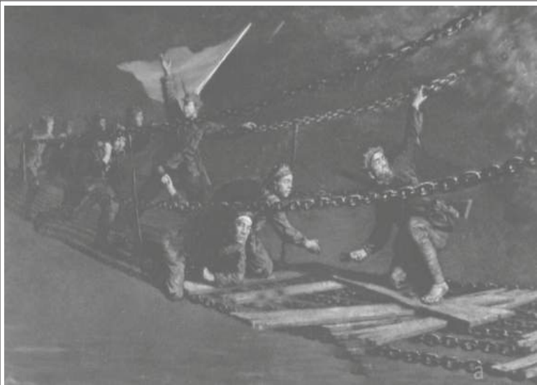
శత్రువు తుపాకీ గుళ్ళ వర్షంకురిపిస్తుండగా టాటూషో నదిని దాటుతున్న రెడార్లీ యోధులు

చిన్నదశం ఒడ్డుకు ఎక్కుతూ, రక్షణ తీసుకుంటూ శత్రువు స్థానాలకు పైగా వున్న ఒక ఎత్తయిన ప్రదేశాన్ని మెల్లగా చేరుకొన్నారు. అక్కడ వారు తమ మర తుపాకుల్ని నెలకొల్పుతున్నారు. నదికి దగ్గరలో వున్న శత్రువుల పైకి తూటాలను, చేతి బాంబులను వర్షంలా కురిపించారు.