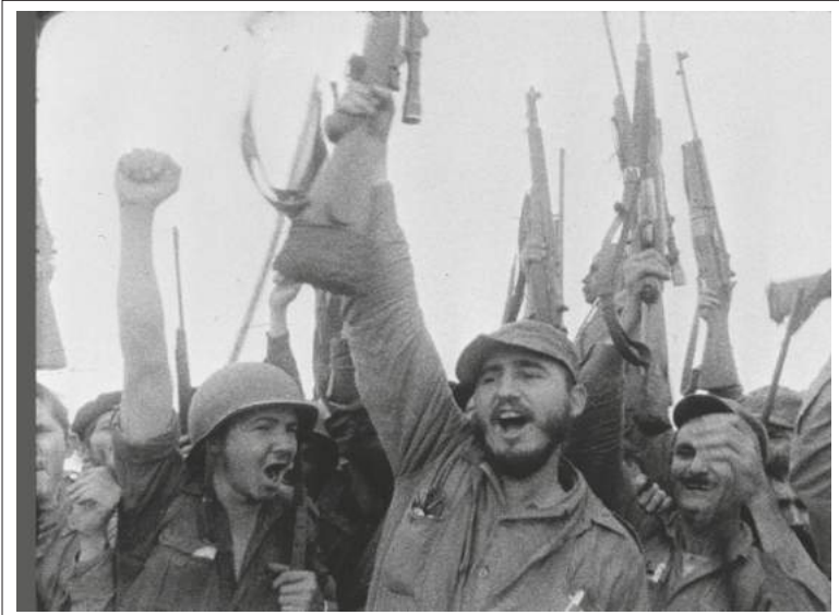
కాస్ట్రో నాయకత్వంలో క్యూబా విప్లవాన్ని జయప్రదం చేసిన గెరిల్లా బృందం

“ 1973లో అమెరికా ప్రోద్బలంతో జనరల్ అగస్టో పినోచెట్ సారధ్యంలో ఈ పాపులర్ ఫ్రంట్ ప్రభుత్వం కూలదోయబడింది. కమ్యూనిస్టులను సామూహిక హత్యలతో, అరెస్టులతో కాలరాచివేశాడు పినోచెట్. పలువురు కమ్యూనిస్టులను హెలి కాప్టర్లలో తీసుకుపోయి ఆ పైనుంచి పసిఫిక్ సముద్రంలో తోయించాడు. డైనమైట్లతో చాలా మందిని ముక్కలుముక్కలు చేశాడు. ”