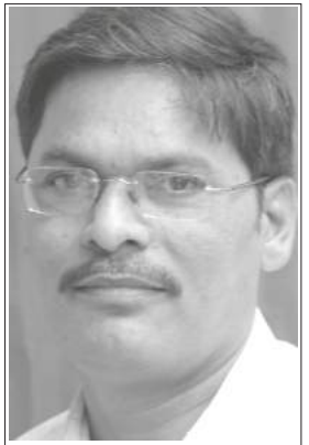
రచయిత సిపిఐ(ఎం) కేంద్ర కమిటీ సభ్యులు

అస్తిత్వవాదంతో విముక్తి సాధించలేమా? అస్తిత్వవాదానికి పునాది ఏమిటి? పెట్టుబడిదారీ వ్యవస్థ పరిధిలో సామాజిక న్యాయం సాధ్యమా? కులం పరిధిలో విశ్లేషణ విముక్తి సాధనకు మార్గమవుతుందా?