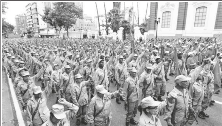
బొలివేరియన్ విప్లవానికి మద్దతుగా నిలబడిన వెనిజులా సైన్యం

“ వెనిజులాలో సంప్రదాయకంగానే స్థానిక హక్కులు, సమానత్వం, పర్యావరణ న్యాయం వంటి సామాజిక ఉద్యమాలు బలహీనంగా ఉన్నాయి. ఇదే వెనిజులా, బొలివెరియాల్ మధ్య తేడా. బొలివెరియాలో ఇటువంటి ఉద్యమాల ద్వారా ఇవో మొరల్స్ పార్టీ బలపడింది. వెనిజులాలో బలమయిన స్వతంత్ర పునాది లేకపోవడం వలన పార్టీయే మూలాధారం.”