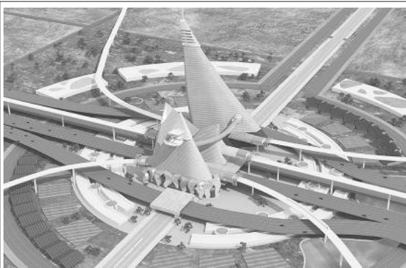
గుజరాత్ లోని ధోలేరి స్కార్ప్ సిటీ

తొలుతగా ‘ధోలేరా సర్’గా పేరు పెట్టుబడిన ఈ ప్రాజెక్టు క్రమంగా ‘ధోలేరా మెట్రో సిటీ’గా మారింది... అంతేకాక, అధికారి కంగా ‘సిటీ కీ ముందు, సూపర్/టెక్/ఫ్యూచర్/డీఎమ్/మెగా/గ్రీన్ ఫీల్డ్’ వగైరా పదాలను చేర్చుకుంటూ కొనసాగుతున్నది. దీనిలోనే ‘గ్రీన్ ఫీల్డ్ ఆన్ మెగా ఎయిర్పోర్ట్ కూడా ఉంది... ఈ మొత్తం ప్రాజెక్టు 30 సంవత్సరాలలో వాస్తవ రూపం దాల్చునుంది. కానీ విమర్శకుల ప్రకారం, ఈ ప్రాజెక్టు ఎప్పటికీ సాకారం కాదు... కనీసం ముందు చేర్చిన పదం ‘మెగా’లో సగం కూడా సాధ్యం