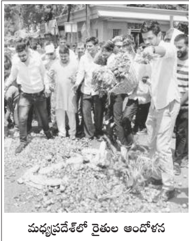
మధ్యప్రదేశ్ లో రైతుల ఆందోళన

నిరంతరం పంట ధరలు కుప్పకూలడం, ప్రభుత్వం వద్ద కొనుగోలు కేంద్రాలు