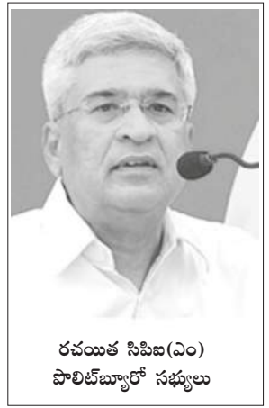
రచయిత సిపిఐ(ఎం) పొలిట్ బ్యూరో సభ్యులు

వందేళ్ళ క్రితం యూరప్ లో సోషల్ డెమోక్రటిక్ సంస్కరణవాదం బలంగా ప్రభావం కలిగివుండేది. ఆటువంటి పరిస్థితినుండి చరిత్రను బలంగా మలుపు తిప్పింది రష్యన్ విప్లవం. ఆనాడు లెనిన్ రష్యన్ విప్లవం వెనువెంటనే జర్మనీలో విప్లవం విజయవంతం ఔతుందని ఆశించాడు. 1919లో జర్మనీలో తలెత్తిన విప్లవం అణచివేతకు గురవడంతో ఆ ఆశ నెరవేరలేదు.