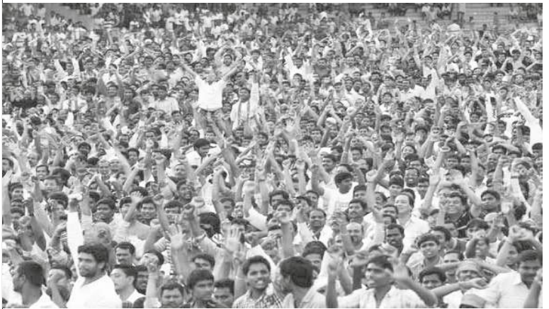
కులాల పేరుతో సమీకరణలు

“ మరోవైపు సామాజిక న్యాయం కోసం జరిగే ఈ కృషి కులాన్ని బలహీనపర్చదు. కొనసాగిస్తుంది. పాలక వర్గాల ప్రయోజనాలకు ఇది ఆటంకం కాదు. ఈ బల హీనతను కూడా అర్థం చేసుకోవాలి. కమ్యూనిస్టులు సామాజిక న్యాయం కోసం మాత్రమే కాకుండా కులవివక్ష మీద తిరుగుబాటుకూ, కుల నిర్మూలనకూ కృషి చేస్తారు. అందుకే కమ్యూనిస్టుల లక్ష్యం మరింత గొప్పది. ”