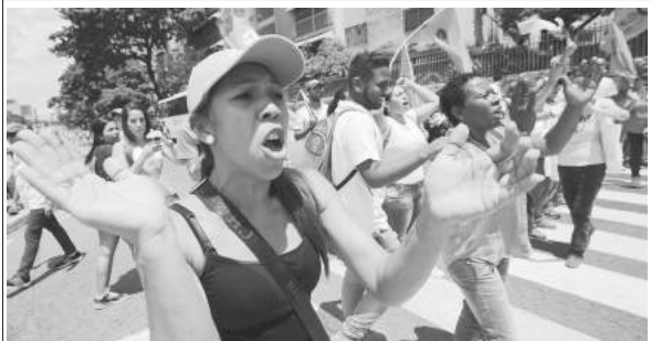
అమెరికా ప్రోద్బలంతో ప్రభుత్వానికి వ్యతిరేకంగా ఆందోళన చేస్తున్న ప్రతిపక్షాలు

“ విధానాలు, ఎత్తుగడల రూపకల్పనలోనూ, వాటి అమలులో ఒక ముఖ్యమయిన సమస్య సామాజిక న్యాయం, సమానత్వంతో ముందుకునడవడం. చావిస్తా ఉద్యమానికి రెండూ మార్గదర్శకాలు. దేశంలోని అంచులకు నెట్టివేయబడిన వారిలోను, వెనకబడిన తరగతులలోను ప్రాచుర్యం పొందడానికి ఇవి కారణం కూడా. ఇందులో ఏ విభేదాలు లేవు. ”