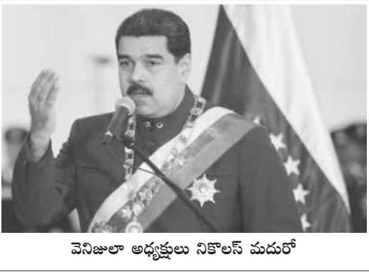
వెనిజులా అధ్యక్షులు నికోలస్ మదురో

చెల్లింపులను అదుపు చేయడం. కానీ అది అమలు కాలేదు. సాంప్రదాయ వ్యాపారస్తులే ఈ కాంట్రాక్టులలో అధిక శాతం పొందుతున్నారనేది చావిస్తాల వాదన. వారికున్న అనుభవం వలన, అధిక పెట్టుబడుల వలన వారే పొంద గలుగుతున్నారు. అందులోని భాగమే ఓడ్రెక్ట్ కాంట్రాక్ట్ వీరికి బులా దా సిల్వా పర్మన్ పార్టీతో సన్నిహిత సంబంధాలు ఉన్నాయి. ఈ సంబంధాల కారణంగా పర్మన్ పార్టీ కూడా ఇబ్బందులలో పడింది. అనేకమంది రాజకీయ