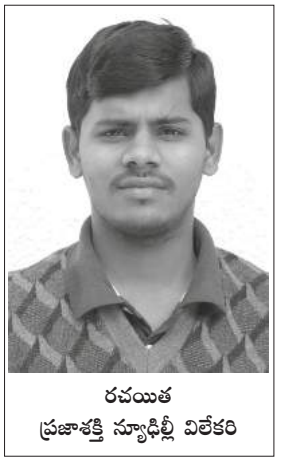
రచయిత ప్రజాశక్తి న్యూఢిల్లీ విలేకరి