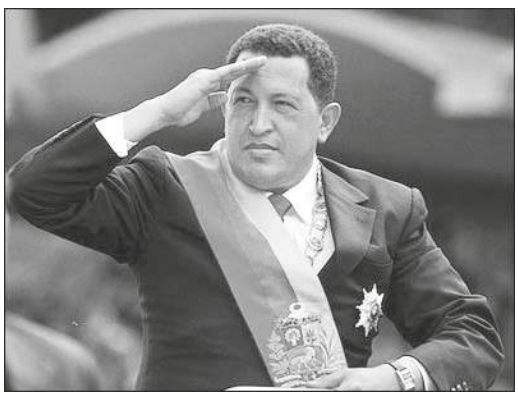
వెనిజులా విప్లవనేత హ్యూగో చావెజ్

“మార్కు సాధించే క్రమంలో ఆ లక్ష్య సాధనకు అవసరమయిన ఆర్థిక, రాజకీయ స్థిరత్వం సాధించేందుకు ఒక ఎత్తుగడగా చూడాలి. అధికార మార్పు జరిగేందుకు అవకాశం ఉన్నట్లు తెలిసిన మరుక్షణంలో, ప్రభుత్వానికి అనుకూలంగా చెప్పుకుంటున్న వ్యాపారవర్గం చావిస్తా ప్రభుత్వాన్ని వదిలి వేస్తారని అనేకసార్లు హెచ్చరించడం జరిగింది.”