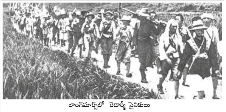
లాంగ్మాచ్ లో రెడార్మ్ సైనికులు

నిస్టుల మర తుపాకులు కాల్పులు సాగించాయి. వంతెనకి అవతలివైపు స్థానాల మీద తూటాల వర్షం కురిపించారు. శత్రువు కూడా తన మరతుపాకులతో సమాధానమిచ్చాడు. నీటి మట్టానికిపైన వ్రేళ్లాడుతూ మెల్లగా తమవైపుకు వస్తున్న కమ్యూనిస్టులపైన గురిచూసి కాల్పులు జరపటం మొదలెట్టారు. మొట్టమొదట యోధుడు తూటాదెబ్బకి గురై ప్రవహిస్తున్న నీటిలో పడి పోయాడు. అయితే మిగిలినవారు వంతెనమధ్యకి వెళ్ళేకొలది ఆ వంతెనమీదలగల చెక్కతో నిర్మించిన దారి చావటానికైనా సిద్ధపడిన ఈ సాహస వీరులకు కొంతమేరకు రక్షణగా సహాయపడింది. శత్రువు పేల్చిన తూటాల్లో హెచ్చుభాగం వీరిమీదుగా వెళ్ళిపోయాయి. లేదా అవతల ఒడ్డున వున్న కొండలకు తగిలాయి. ఇటువంటి యోధులను, సైనికులుగా వుండటమంటే ఒక పక్షం తిండి తినటంగాక విజయం సాధించటానికై ఆత్మహత్యకైనా సిద్ధపడే యువకులను సెచువానీయులు బహుశా ఇంతకు ముందెన్నడూ చూసివుండలేదు. వాళ్ళ మానవ మాత్రులా లేక పిచ్చివాళ్ళా, లేక దేవత లా? లేకపోతే తమ మనోనిబ్బరమే దెబ్బతీస్తాడా? వాళ్ళని చంపటానికై అసలు కాల్పులు జరుపనే లేదా? ఈ మనుషులు తమ ప్రయత్నంలో విజయం పొందాలని తమలో కొందరు దేవుణ్ణి ప్రార్థించారా? చివరికి ఒక కమ్యూనిస్టు వంతెన దారి మీదకి వచ్చి ఒక చేతిబాంబు పిన్న నోటితో లాగి శత్రు సైనిక కేంద్రంపైన సరిగ్గా గురిచూసి విసిరాడు. వంతెనలో మిగిలిన సగం చెక్కల్ని గూడా లాగిపార వేయవలసినదని జాతీయ వాద సైనిక ఆఫీసర్లు వుత్తరువులు జారీచేశారు. అయితే, అప్పటికే చాలా ఆలస్యం అయిపోయింది. మరింత మంది కమ్యూనిస్టులు వచ్చేస్తున్నారు. చెక్కలపైన పారాఫిన్ నూనె పోశారు. వంతెన తగులబడటం ప్రారంభమైంది. ఆ సమయాని కల్లా దాదాపు 20 మంది కమ్యూనిస్టులు చేతులతోను, మోకాళ్ళతోను పాకుకుంటూ ముందుకు వస్తున్నారు. శత్రువు మరతుపాకి