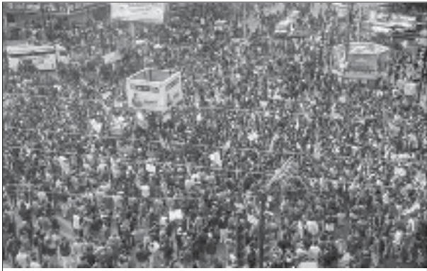
ఎన్ఆర్ఐసి వ్యతిరేకంగా ఢిల్లీలో జరిగిన భారీ ర్యాలీ

అంతర్జాతీయ సూత్రాలు, దేశంలోని చట్టాలు ఏం చెబుతున్నా బెజిపి ప్రభుత్వం కేవలం మతపరమైన హింసాకాండకు గురయిన వారిపట్ల, గురవుతామనుకునే వారిపట్ల మాత్రమే 'మానవతా దృక్పథం' ప్రదర్శించడం, అది కూడా ముస్లిమేతర మతస్తులపట్ల