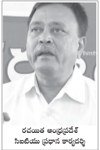
రచయిత ఆంధ్రప్రదేశ్ నిబటియు ప్రధాన కార్యదర్శి

కేంద్ర ప్రభుత్వం అనుసరిస్తున్న కార్మిక, ప్రజావ్యతిరేక విధానాలకు వ్యతిరేకంగా 2020 జనవరి 8వ తేదీన జాతీయ సార్వత్రిక సమ్మే నిర్వహించాలని దేశంలో ఉన్న ప్రధాన కార్మిక సంఘాలు, స్వతంత్ర జాతీయ ఫెడరేషన్లు కలిసి పిలుపునిచ్చాయి. నరేంద్రమోడీ నాయకత్వంలోని భారతీయ జనతాపార్టీ ప్రభుత్వం కేంద్రంలో అధికారంలోకి వచ్చిన తర్వాత భారత కార్మికవర్గం జరుపుతున్న 4వ జాతీయ సమ్మే ఇది. గత మూడు జాతీయ సమ్మేలలో ప్రతి సమ్మేలో 18-20 కోట్ల మంది కార్మికులు పాల్గొని, ప్రభుత్వ విధానాల పట్ల తమ తీవ్ర వ్యతిరేకతను స్పష్టం చేశారు. ఇంత భారీ సంఖ్యలో కార్మికులు సమ్మేల ద్వారా రోడ్లు ఎక్కుతున్నా బిజెపి ప్రభుత్వం లెక్కచేయకుండా తన కార్మిక వ్యతిరేక విధానాలను కొనసాగిస్తూనే ఉన్నది. ప్రత్యేకించి రెండో సారి ఎన్నికైన తర్వాత బజెపి తన దూకుడును మరింతగా పెంచి కార్మికుల, ఉద్యోగుల హక్కులన్నింటినీ తొలగించి, వారిని పెట్టుబడిదారుల వద్ద ఆధునిక బానిసలుగా మార్చేందుకు తీవ్రంగా ప్రయత్నిస్తున్నది.