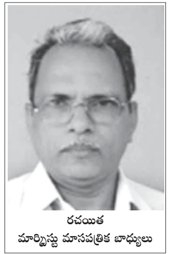
రచయిత మార్క్సిస్టు మాసపత్రిక బాధ్యులు

కేంద్ర ప్రభుత్వం కార్మికచట్టాలను నాలుగు కోడ్లుగా కుదించటం వలన కార్మికులతో పాటు దేశ ప్రజానీకం కూడా తీవ్ర దుష్పరిణామాలను ఎదుర్కొంటారు. ప్రభుత్వం తీసుకొస్తున్న చట్ట సవరణలతో కార్మికుల ఆదాయాలు పడిపోతాయి. వారి జీవన ప్రమాణాలు దిగజారతాయి. నిరుద్యోగం పెరుగుతుంది. పంటలకు మద్దతు ధరలు, మార్కెట్ ధరలు పడిపోతాయి. రైతాంగం అప్పుల పాలవటం, అత్యుపాత్యలు చేసుకోవటం పెరుగుతుంది. పారిశ్రామికాభివృద్ధి పతనమౌతుంది. మాంద్యం మరింత తీవ్రమౌతుంది. ప్రధాని మోడి గొప్పగా ప్రచారం చేస్తున్న మేకిన్ ఇండియాకు విఘాతం కలుగుతుంది. మొత్తంగా ప్రజల జీవన ప్రమాణాలు పడిపోవటానికి, దరిద్రం పెరగటానికి ఈ చర్యలు దారితీస్తాయి. అందువలన రైతాంగం, వ్యవసాయ కార్మికులు, గ్రామీణ ప్రజానీకం, దేశంలోని పీడితవర్గాలు, మధ్యతరగతి, చిన్న, మధ్యతరహా పరిశ్రమల యజమానులు, తదితరులంతా జనవరి 8వ తేదీన కార్మికవర్గం చేస్తున్న సార్వత్రిక సమ్మేకు సంపూర్ణ మద్దతునివ్వాలి. సమ్మే కార్మికవర్గానికి ఎంత అవసరమో, మిగతా పీడితప్రజలకు కూడా అంతే అవసరమనే చైతన్యాన్ని కలిగించాలి. ప్రభుత్వం ప్రవేశపెట్టిన వేతనాలకు సంబంధించిన కోడ్స్ను ఆగస్టు నెలలో ఉభయ సభలు ఆమోదించాయి. అనంతరం రాష్ట్రపతి ఆమోదం తెలపటంతో చట్టంగా మారింది. యజమానుల ఆకాంక్షలకు అనుగుణంగా సంఘం పెట్టుకోవటానికి, సమ్మేవేయటానికి కార్మికులకు ఉన్న హక్కులను హరించటం, వారి వేతనాలను తగ్గించటం, ఆధునిక బానిసల స్థాయికి కార్మికులను దిగజార్చటం ప్రభుత్వం రూపొందిస్తున్న కోడ్లలోని ప్రధానాంశాలు. 2017లో కేంద్ర ప్రభుత్వం నిపుణత లేని పనులకు 176 రూపాయలను కనీస వేతనంగా ప్రభుత్వం నిర్ణయించింది. రెండు సంవత్సరాల అనంతరం 2 రూపాయలు మాత్రమే పెంచి 178 రూపాయలను కనీస వేతనంగా కేంద్ర కార్మికశాఖమంత్రి ప్రకటించాడు. రెండు సంవత్సరాల తర్వాత 1.36