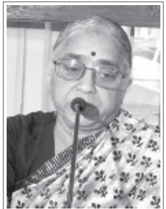
రచయిత సిబిటియు అఖిలభారత అధ్యక్షురాలు

మోడి నాయకత్వంలోని బిజెపి ప్రభుత్వం అనుసరిస్తున్న ప్రైవేటీకరణ విధానాలకు వ్యతిరేకంగా డిసెంబరు నెల మొత్తం ఆందోళనలు కొనసాగించాలని, 2020 జనవరి 8వ తేదీన దేశవ్యాపితంగా జరగునున్న సార్వత్రిక సమ్మేకు విస్తృత ప్రజామద్దతును సమీకరించాలని సిపిఐ(ఎం) పిలుపునిచ్చింది. జాతి సంపదగా ఉన్న ప్రభుత్వరంగ సంస్థల ప్రైవేటీకరణను ఆపాలన్నది సమ్మేకు పిలుపునిచ్చిన కార్మిక సంఘాలు లేవనెత్తిన ప్రధాన డిమాండ్లలో ఒకటి. మాంద్యం చుట్టుముడుతున్న ప్రస్తుత పరిస్థితులలో మరింత తీవ్రం అవుతున్న నిరుద్యోగం, కార్మిక ప్రయోజనాలకు వ్యతిరేకంగా కార్మిక చట్టాలలో సవరణలు చేయటం, ఉద్యోగాలు చేస్తున్నవారు ఎప్పుడు ఉద్యోగాలు కోల్పోతామో తెలియక పడుతున్న ఆందోళన తదితర అంశాలను కార్యకర్తల సంఘాలు ప్రధానంగా లేవనెత్తుతున్నాయి.