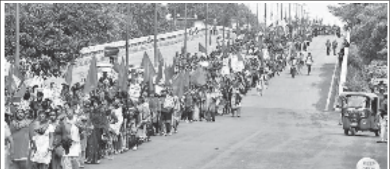
మోడీ ప్రభుత్వ కార్మిక వ్యతిరేక విధానాలను నిరసిస్తూ పార్లమెంటుకు కార్మికుల ప్రదర్శన

“ తమ న్యాయమైన కోర్కెల సాధన కోసం కార్మికులు చేస్తున్న అన్ని పోరాటాలకు దేశంలోని సామాన్య ప్రజలు, రైతులు, వ్యవసాయ కార్మికులు, యువత, విద్యార్థులు, అభ్యుదయ భావాలు కలిగిన అన్ని తరగతుల ప్రజలు తమ సంఘీ భావాన్ని, చురుకైన మద్దతును అందిస్తున్నారు. 2015 నుండి జరుగుతున్న సార్వత్రిక సమ్మెలన్నింటిలోనూ ఇది ప్రత్యేకమైన అంశంగా కనిపిస్తున్నది. 2020 జనవరి 8వ తేదీన అఖిల భారత కిసాన్ సభ, ఇతర రైతుసంఘాలు గ్రామీణబంద్ కు పిలుపునిచ్చాయి. ”