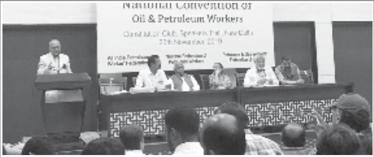
ప్రైవేటీకరణను వ్యతిరేకిస్తూ నవంబర్ 20న న్యూఢిల్లీలో జరిగిన ఆయిల్, పెట్రోలియం కార్మికుల సదస్సు

“ సంపదను సృష్టించటంలో తనపాత్రను కూడా భారత కార్మికవర్గం నెమ్మదిగా గుర్తిస్తున్నది. బడా కార్పొరేట్లు సంపదను సృష్టిస్తారని మోడి చేసిన వ్యాఖ్యలను ప్రస్తావించి, సంపదను సృష్టించేవారం తామేనని ఉమ్మడి ప్రకటనలో దృఢంగా ప్రకటించారు. తాము సృష్టించిన సంపదను ప్రభుత్వ మద్దతుతో కార్పొరేట్లు దోపిడీ చేస్తున్నారని, అది డిమాండ్ తగ్గటానికి, మాంద్యానికి దారితీస్తున్నదని, తాము సృష్టించిన సంపదను సమానంగా పంపిణీ చేయాలని డిమాండ్ చేశారు.”