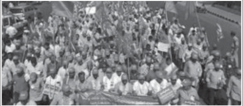
ప్రైవేటీకరణను వ్యతిరేకిస్తూ విశాఖ ఉక్కు ఫ్యాక్టరీ కార్మికుల ప్రదర్శన

“ అసంఘటిత రంగంలో పని చేస్తున్న కార్మికులందరికీ కనీస వేతనం రూ.21 వేలు చెల్లించాలని ప్రధానమైన డిమాండ్. కేంద్ర ప్రభుత్వం 2017లో నెలకు కనీస వేతనం రూ.18 వేలుగా నిర్ణయించింది. 1957లోని జాతీయ కార్మిక సమావేశం ప్రకారం ఒక కార్మికుని కుటుంబంలోని 4 గురు సభ్యులకు అవసరమైన ఆహారం, దుస్తులు, ఇంటి అద్దెతో పాటు సుప్రీం కోర్టు నిర్ణయించిన విద్య, వైద్య అవసరాలను కుటుంబానికి కేంద్ర ప్రభుత్వం ఆ నిర్ణయం చేసింది.”