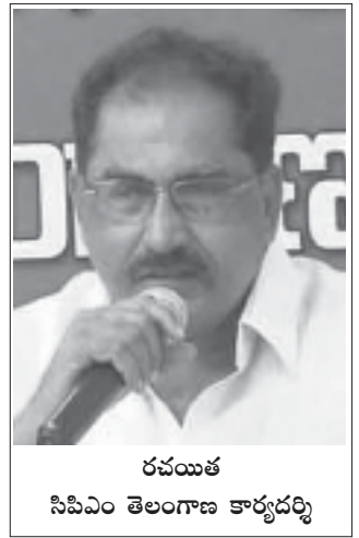
రచయిత సిపిఎం తెలంగాణ కార్యదర్శి

10 జాతీయ కార్మిక సంఘాలు, స్వతంత్ర కార్మిక సంఘాలు, వివిధ రంగాలకు చెందిన అసోసియేషన్స్, మరెన్నో స్వతంత్ర సంఘాలు కలిసి 2020 జనవరి 8న దేశవ్యాప్త సార్వత్రిక పారిశ్రామిక సమ్మెకు పిలుపిచ్చాయి. సరేంద్ర మోడీ నాయకత్వంలో రెండోసారి అధికారంలోకి వచ్చిన బిజెపి పాలనలో అమలువుతున్న కార్మిక వ్యతిరేక, ప్రజావ్యతిరేక, జాతి వ్యతిరేక విధానాలకు నిరసనగా ఈ పిలుపు ఇవ్వబడింది.