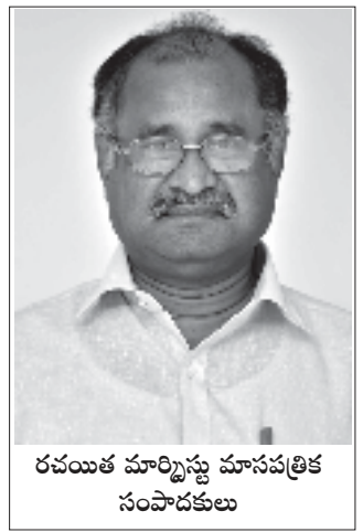
రచయిత మార్పిస్తు మాసపత్రిక సంపాదకులు