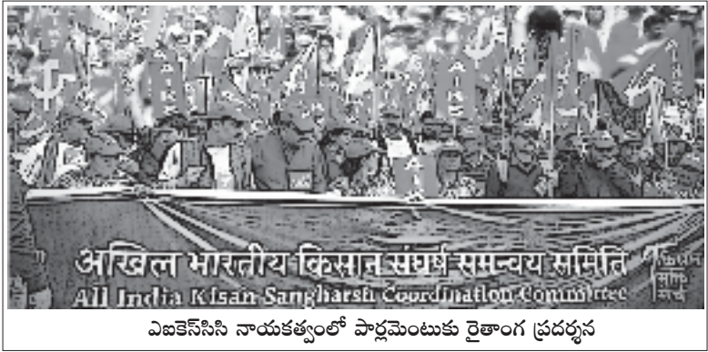
ఎఐకెసిసి నాయకత్వంలో పార్లమెంటుకు రైతాంగ ప్రదర్శన

“ఈ అనుభవాలు అనేక పాఠాలను నేర్పించాయి. ఆ దిశగా అఖిల భారత కిసాన్ సభ ఇప్పటికే సంస్థాపరంగా ఐక్య ఉద్యమ నిర్మాణాన్ని ఆచరణలో పెట్టి “ప్రతిగ్రామంలో కిసాన్ సభ: ప్రతి రైతు కిసాన్ సభలో” అనే నినాదంతో ఉద్యమిస్తున్నది. స్వతంత్ర, ఐక్య ఉద్యమాల నిర్మాణాన్ని కొనసాగిస్తూ మరింత బలోపేతం చేసేందుకు ప్రణాళికలు వేస్తున్నారు. 2019 ఆగస్టు 2న ఎఐకెఎస్ కార్మిక హక్కులపై జరిగిన దాడిని వ్యతిరేకిస్తూ కార్మిక సంఘాలకు సంఘీభావం ప్రకటించింది.”