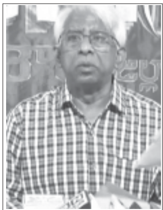
రచయిత సిబిటియు ఆంధ్రప్రదేశ్ అధ్యక్షులు

నెల్లూరులో డిసెంబరు 15 నుంచి 17 వరకూ సిబిటియు ఆంధ్రప్రదేశ్ మహాసభలు జరిగాయి. ప్రతి మహాసభకు ఒక ప్రత్యేకత ఉంటుంది. మూతున్న రాజకీయ నేపథ్యంలో ఈ మహాసభలకు చాలా ప్రాధాన్యత ఉంది. స్వాతంత్రం వచ్చిన అనంతరం కార్మికహక్కులపై ఇంత దాడి ఎన్నడూ జరగలేదు. స్వాతంత్ర్యం ముందు నుంచి పోరాడి సాధించుకున్న హక్కులను బిజెపి ప్రభుత్వం కబళిస్తున్నది.