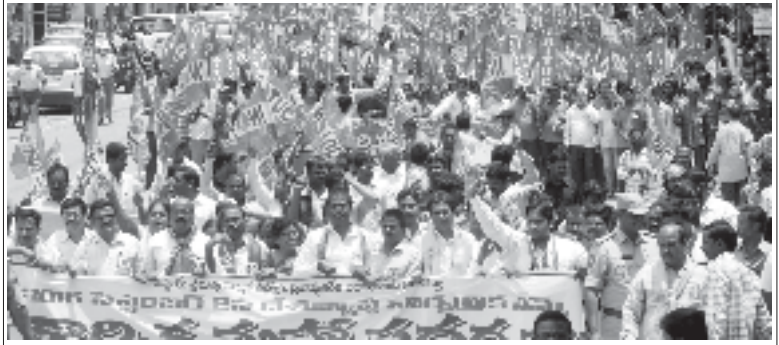
2016లో జరిగిన సార్వత్రిక సమ్మేలో పాల్గొన్న కార్మికులు, ఉద్యోగులు

“పెద్దసంఖ్యలో తనకు ఓటుచేసిన ప్రజలు, కార్మికులు, ఉద్యోగులు తదితరులు తాను తీసుకుంటున్న వినాశకరమైన నిర్ణయాలను మౌనంగా ఆమోదిస్తారని బిజెపి ప్రభుత్వం భావిస్తున్నది. ఆ విధంగా చేయటం ద్వారా ప్రజాభిప్రాయాన్ని ప్రభుత్వం తప్పుగా అర్థం చేసుకొంటున్నదని స్పష్టమౌతున్నది. బిజెపి ప్రభుత్వం అధికారానికి వచ్చిన వెంటనే పార్లమెంటు ఎన్నికలలో ఆ పార్టీకి ఓటుచేసిన ప్రజలలో ఎక్కువ మంది దాని విధానాలను వ్యతిరేకించటం ప్రారంభించారు.”