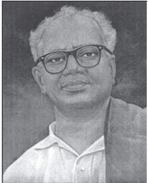
అమీర్ హైదర్ ఖాన్ తయారుచేసిన ఆణిముత్యం: దక్షిణ భారత దేశ కమ్యూనిస్టు ఉద్యమ నిర్మాత కామ్రేడ్ పుచ్చలపల్లి సుందరయ్య

1914లో బొంబాయి వెళ్లి, అక్కడి నుండి లండన్ వెళుతున్న ఒక ఓడలో పనివాడిగా కుదిరారు. తిరగబడే స్థాభావం ఉండడం వలన తన తోటి కార్మికులకు జరిగిన అన్యాయాన్ని ఎదిరించడానికి యాజమాన్యంతో పోరాడి విజయం సాధించారు. 1918లో అమెరికన్ వాణిజ్యనౌకలో చేరారు. అందులో పని అతనిని యూరప్, అమెరికా, తూర్పు ప్రాంతమేకాక ప్రపంచమంతా తిరిగే అవకాశం కలిగించింది. అంతర్జాతీయ వ్యవహారాలు నేర్పించింది. వలస