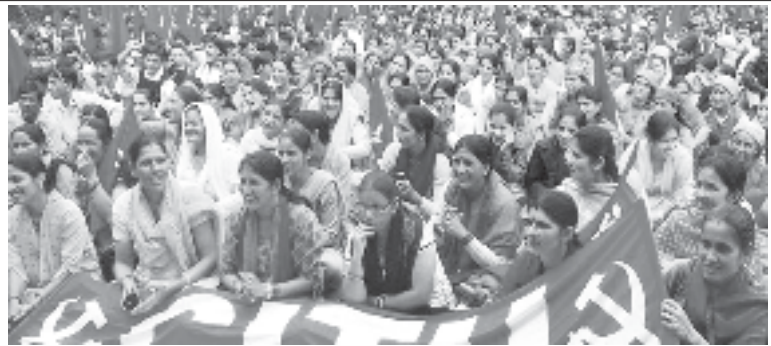
కార్మికుల సమస్యల పరిష్కారం కోసం యూనియన్ల నాయకత్వంలో పోరాటాలు

“కార్మికులు సంఘాలు పెట్టుకునే హక్కును, ఉమ్మడిగా బేరసారాలాడుకునే హక్కును గ్యారంటీ చేసిన అంతర్జాతీయ కార్మిక సంస్థ 87, 88 కన్వెన్షన్ తీర్మానాలపై ప్రభుత్వం ప్రత్యక్ష దాడి చేయటమే తప్ప ఈ ప్రతిపాదిత చట్టం మరోటి కాదు. పని ప్రాంతాల్లో, ఫ్యాక్టరీల్లో కార్మిక సంఘాలకు తావులేదన్న యాజమాన్యపు ధోరణికి అనుకూలంగా చట్టాలను బలహీనం చేయటానికి పూనుకున్నారు.”