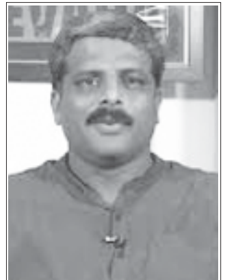
రచయిత ఎఐకెఎస్ సహాయ కార్యదర్శి

సరేంద్ర మోడీ నాయకత్వంలోని బిజెపి ప్రభుత్వం వ్యవసాయ కార్మికులు, రైతులు, కౌలు రైతులు, ఇతర గ్రామీణపేదలకు చేసిన వాగ్దానాలను అమలు చేయకుండా చేసిన సమృద్ధిలోనికి, సమస్యల పరిష్కారంపై ప్రదర్శిస్తున్న నిర్లక్ష్యానికి వ్యతిరేకంగా జనవరి 8వ తేదీన జరగనున్న సార్వత్రిక సమ్మేలో భాగంగా గ్రామీణబండ్లో గ్రామీణ శ్రామికులంతా పాల్గొని జయప్రదం చేయాలి. కనీసవేతనాల అమలు, ఉచిత విద్య, వైద్యం, కౌలురైతుల గురింపు, రైతాంగ ఉత్పత్తులకు గిట్టుబాటు ధరలు, రుణాల రద్దు తదితర సమస్యల పరిష్కారంకోసం వ్యవసాయ కార్మికులు, రైతులు, కౌలురైతులు, ఇతర గ్రామీణపేదల ఐక్యంగా పోరాడటమే మార్గం. ఆయా వర్గాలకు ప్రాతినిధ్యం వహిస్తున్న సంఘాలు గ్రామీణబండ్ను జయప్రదం చేయమని పిలుపునిచ్చాయి. గ్రామీణబండ్ను జయప్రదం చేయటం ద్వారా మోడీ ప్రభుత్వ రైతాంగ, వ్యవసాయ కార్మిక, గ్రామీణ పేదలకు వ్యతిరేక విధానాలపై సమరశంఖం పూరించాలని విజ్ఞప్తి చేస్తున్నాం.