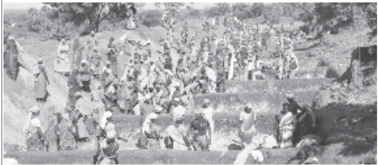
ఉపాది హామీ పనులు చేస్తున్న వ్యవసాయ కార్మికులు

“తీవ్రమైన కరువు పరిస్థితుల వల్ల జీవనోపాధి కోసం గ్రామీణ ప్రాంతాల నుండిపట్టణ ప్రాంతాలకు పెద్దసంఖ్యలో వలసలు వెళుతున్నారు. పనికోసం ఎదురుచూస్తున్న గ్రామీణ ప్రాంత నిరుద్యోగులను ఆదుకునేందుకు వీలుగా ఎంజిఎన్ఆర్ఐజిఎ ద్వారా పనులు కల్పించడంతో పాటు, ఆహార భద్రతను కల్పించే విధంగా కేటాయింపులను పెంచాలి. కాని ప్రభుత్వం అందుకు పూర్తి భిన్నంగా చేస్తున్నది. ఇందుకోసం గత యేడాది కంటే వెయ్యి కోట్లు తక్కువగా కేటాయింపులు చేశారు.”