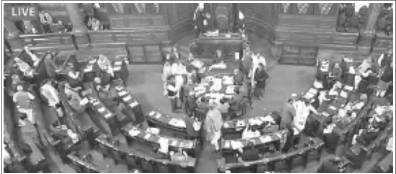
వేజ్ కోడ్ బిల్లుపై చర్చిస్తున్న పార్లమెంటు

“1991లో కాంగ్రెస్ పార్టీ లాంఛనంగా ఈ నయా ఉదారవాద విధానాలను ఆరంభించింది. కాంగ్రెస్, బిజెపిలు అధికారంలో ఉన్నా ప్రతిపక్షంలో ఉన్నా కార్మికవర్గ ప్రయోజనాలను హరించే చట్టాలు చేసే విషయంలో రెండు పార్టీలు తోడు దొంగ లుగా వ్యవహరించాయి. బూర్జువా పార్టీల నాయకత్వంలోని అనేక రాష్ట్ర ప్రభుత్వాలు ఈ విధానాలను అమలు చేస్తున్నాయి. కార్మిక చట్టాలను సంపూర్ణంగా సవరించటంలో తొలి అడుగు వేసింది రాజస్థాన్ లోని బిజెపి ప్రభుత్వం.”