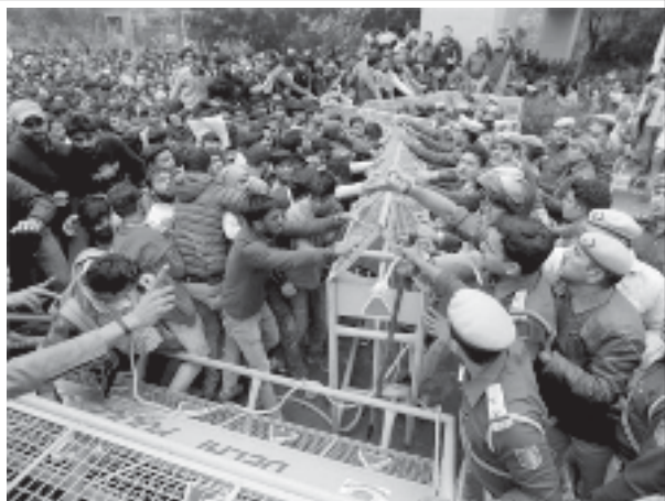
సిఎ-ఎన్ఆర్సికి వ్యతిరేకంగా ఆందోళన చేస్తున్న జామియా మిలియా విశ్వవిద్యాలయం విద్యార్థులను అడ్డుకుంటున్న ఢిల్లీ పోలీసులు

పార్లమెంటు ఉభయ సభల్లో పౌరసత్వ సవరణ బిల్లు (కాబ్) ఆమోదం పొంది చట్టంగా మారిన వెంటనే అస్సాంలో పెద్ద ఎత్తున ప్రజా నిరసన ప్రారంభమైంది. వారం రోజుల పాటు అస్సాం రణరంగంగా మారింది. మోడీ ప్రభుత్వం చేసిన పౌరసత్వ సవరణ చట్టం 1985లో కేంద్ర ప్రభుత్వానికీ, అస్సాం ఉద్యమకారులకీ మధ్య కుదిరిన అస్సాం ఒప్పందాన్ని వమ్ము చేస్తుంది. ఆ ఒప్పందం ప్రకారం 1971 మార్చి 24 తరువాత రాష్ట్రంలోకి ప్రవేశించిన