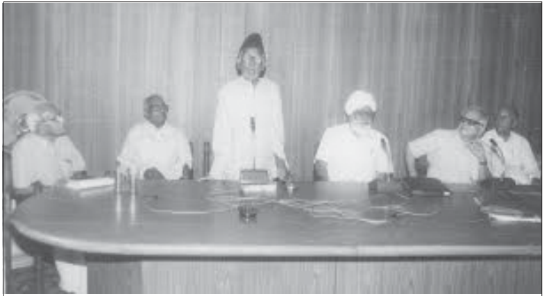
సిపిఐ(ఎం) అగ్రనేతలు ఇఎంఎస్, సూర్జిత్, రణదివే, జ్యోతిబసులతో అమీర్ హైదర్ ఖాన్

ఆయన 1931లో బొంబాయి తిరిగి వచ్చారు. మీరల్ కుట్రకేసులో అప్పటికింకా ఆయన పేరు ఉండడం వలన, భారత కమ్యూనిస్టు పార్టీ కేంద్ర కమిటీ ఆయనను మద్రాసుకు పంపించింది. శంకర్ అనే మారుపేరుతో దక్షిణ భారతదేశంలో రాజకీయ కార్యకలాపాలు కొనసాగించారు. కార్మికులు, కర్షకులలో చురుకుగా పనిచేశారు. 1932లో మద్రాస్ లో యంగ్ వర్కర్స్ లీగ్ ని స్థాపించారు. తాంజోర్ డెల్టాలో రైతులను సంఘటితం చేయడానికి నిర్దిష్టమైన డిమాండ్లను రూపొందించారు. అదేసమయంలో చాలామంది యువకులతో సంబంధాలు ఏర్పరచుకుని వారిని కమ్యూనిస్టు