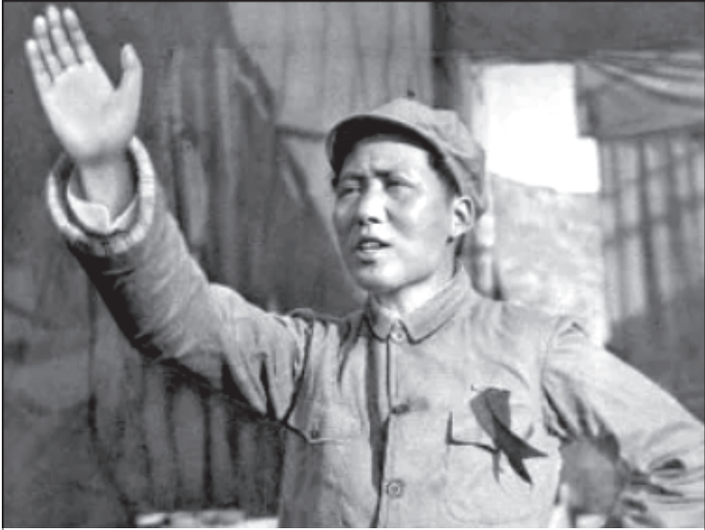
యవ్వనంలో మావో జెడాంగ్

“ 1934లో ప్రారంభమైన వారి ఈ జైత్రయాత్ర ప్రజా చైనా ఏర్పడిందన్న ప్రకటనతో ఆగిపోలేదు. అదింకా ఈనాటి వరకూ అప్రతిహతంగా సాగిపోతూనే ఉంది. భారతదేశానికి స్వతంత్ర్యం వచ్చిన రెండేళ్లకు ప్రజా చైనా స్థాపన జరిగింది. అప్పటికి అది వ్యవసాయిక దేశం. ప్రప్రంచంలోనే అతి పెద్ద జనాభా గల దేశం. అలాంటి దేశం ఈనాడు ప్రగతి సాధించని క్షేత్రం లేదు. వ్యవసాయికం, పారిశ్రామిక రంగం, రవాణా, శాస్త్రసాంకేతిక రంగాలతో పాటు అంతరిక్ష క్షేత్రం లోనూ అద్వితీయ ప్రగతిసాధించింది. ”