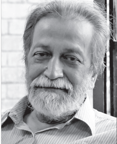
రచయిత ప్రముఖ మార్క్సిస్టు ఆర్థిక వేత్త

లను మరింత పెంచింది. పారిశ్రామిక ఉత్పత్తులను పెద్ద ఎత్తున దిగుమతి చేసి ఇక్కడి చేతివృత్తులను నాశనం చేయడం, పన్నుల పేరుతో రైతులనుండి భారీగా వసూళ్ళు చేసి ఆ ధనంతోనే ఇక్కడి వ్యవసాయోత్పత్తులను చేజిక్కించుకోవడం జరిగింది. దీనివలన తక్కువ కులాల ప్రజల భౌతిక జీవన పరిస్థితులు మరింత దిగజారాయి.