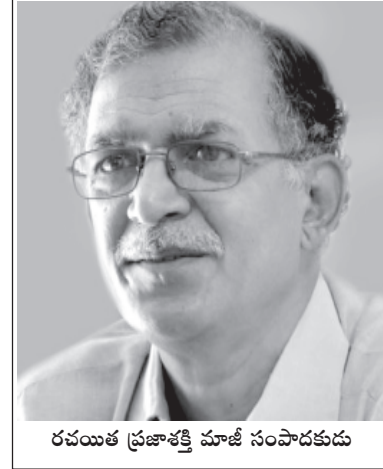
రచయిత ప్రజాశక్తి మాజీ సంపాదకుడు