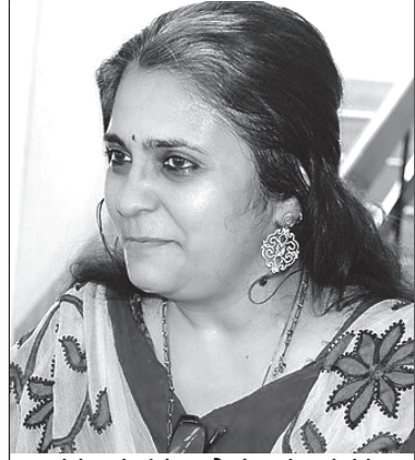
రచయిత ప్రముఖ సామాజిక కార్యకర్త