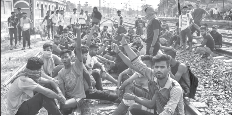
అగ్నిపథ్కు వ్యతిరేకంగా హర్యానాలో నిరసన ప్రదర్శన జరుపుతున్న యువకులు

“ ఆయుధాలలో ప్రాథమిక శిక్షణ పొందిన అగ్ని వీరులు సమాజానికి హానికరంగా మారే ప్రమాదం ఉందని అనేక పరిశోధనలు ,సాహిత్యం తెలియచేస్తున్నాయి. భారతదేశ విభజన సమయంలో, పెద్ద ఎత్తున జరిగిన జాతి శుద్ధి కార్యక్రమంలో పాల్గొన్న వారిలో ఎక్కువమంది రెండో ప్రపంచయుద్ధంలో పాల్గొని బయటికి పంపి వేయబడిన సైనికులే. ”