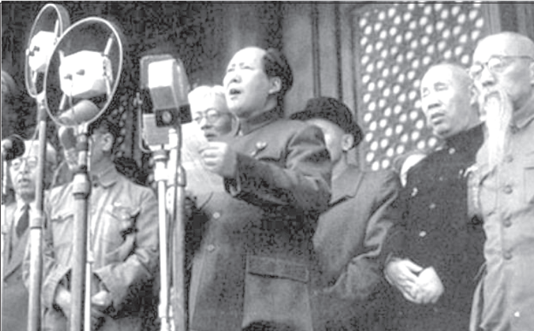
1949 అక్టోబర్ 1న పెకింగ్ (నేటి బీజింగ్)లోని ఫర్ బిడెన్ సిటీ రాజప్రాసాదం నుండి మాట్లాడుతూ “చైనా ప్రజా రిపబ్లిక్” ఏర్పాటును ప్రకటిస్తున్న మావో జెడాంగ్

“మొదటి రెండు సంవత్సరాలు యుద్ధం మంచూరియా వద్ద కేంద్రీకృతమైంది. చియాంగ్ సైన్యాలకు ప్రారంభంలో విజయాలు లభించాయి. అమెరికా పూర్తిగా చియాంగ్ తరపున పనిచేసింది. అయినా చియాంగ్- కై షెక్ సైన్యానికి ఓటమి తప్పలేదు. 1948 చివరకి పీపుల్స్ లిబరేషన్ ఆర్మీ (రెడ్ ఆర్మీ) జనరల్ లిన్-పియావో నాయకత్వంలో మంచూరియాను స్వాధీనం చేసుకుంది. ఉప్పొంగుతున్న ఉత్సాహంతో రెడ్ ఆర్మీ విజయం తరువాత విజయం సాధిస్తూ దక్షిణానికి సాగింది.”