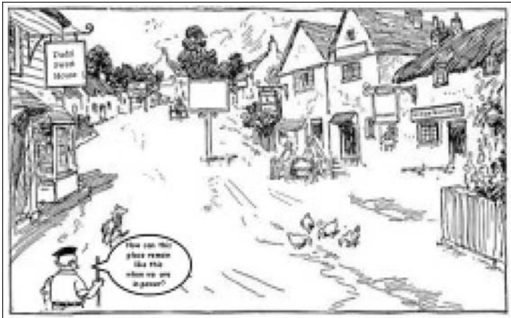
ఆర్ ఎస్ ఎస్ మాత్రమే దీన్ని కనిపెట్టింది.