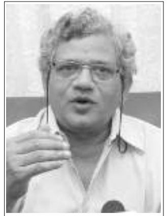
రచయిత సిపిఐ (ఎం) ప్రధాన కార్యదర్శి

కామ్రేడ్ ఫైదల్ కాస్ట్రో మహానిపుణుడు. 20వ శతాబ్దపు ద్వితీయార్థంలో ప్రపంచ రాజకీయ చిత్రంపై అత్యంత ప్రభావం చూపిన బ్రహ్మాండమైన వ్యక్తిత్వం. అంతర్జాతీయ ప్రాముఖ్యత కలిగిన అనేకానేక అంశాలలో తన ముద్రను వేసిన మహావిద్యావంతుడు. తన జీవిత కాలంలో, ప్రయాణించిన మార్గంలో మానవ వికాసం కోసం, స్వేచ్ఛ కోసం ఓ కమ్యూనిస్టు ఆచరించాల్సిన ప్రాథమిక కర్తవ్యాన్ని ఏ క్షణం కూడా విస్మరించని నాయకుడు. భౌతికంగా మనతో లేకున్నా, ప్రపంచ వ్యాప్తంగా మానవత్వ వికాసం కోసం జరిగే ప్రతి పోరాటంలోనూ ఓ ప్రేరణాత్మక శక్తిగా మనతోనే ఉంటారు. ఈ ప్రేరణ ఓ వాస్తవం నుండే ఉద్భవించింది. అత్యంత వెనుకబాటుతనం గలిగిన ఆర్థిక పరిస్థితులలో, వ్యవసాయ తోటలపై ఆధారపడి బ్రతికే బానిస జీవితాలున్న సమాజాన్ని, అత్యంత ఆధునికంగా, సోషలిస్టు దేశంగా మార్చిన ఫైదల్ కాస్ట్రో ఘనత నుండీ వుట్టింది. ఆయన నాయకత్వంలో క్యూబా సాధించిన విజయాలు అసామాన్యమైనవి. జాతి వివక్షను తొలగించడం, స్త్రీల దాస్య విమోచన, పసిబిడ్డల పురణ శాతం అనూహ్యంగా తగ్గించడంలో అత్యంత ప్రభావితమైన ఆరాధ్యనీయ ఫలితాలను సాధించారు. ఉన్నత విద్య, ఆరోగ్యం, ఆరోగ్య పరిశోధనలు, క్రీడా రంగాలలో క్యూబా సాధించిన ప్రగతి ప్రపంచంలో ఎన్నో అగ్రదేశాలకు అనూయ కల్పించేరితిలో ఉంది.