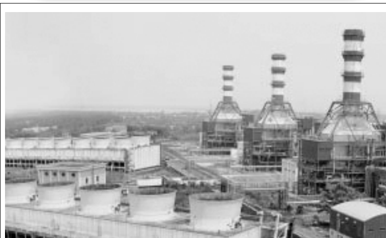
జిఎంఆర్ వేమగిరి విద్యుత్ ప్లాంట్

“ ప్రభుత్వం గత 3 సం.ల కాలంలో (2013-15) పైన ఉదహరించిన దాదాపు రు.1.14 లక్షల కోట్ల ఋణాలను రద్దుచేసింది. 2015-16 ఆర్థిక సంవత్సరంలో రు.60,000 కోట్లు రద్దు చేశారు. రద్దైన వాటిలో విద్యుత్ రంగం నుండి తీసుకున్న ఋణాలే ఎక్కువ ఉన్నాయి. ”