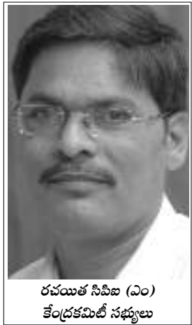
రచయిత సిపిఐ (ఎం) కేంద్రకమిటీ సభ్యులు

కమ్యూనిస్టు పార్టీ శ్రేణులు సరైన రాజకీయ, సైద్ధాంతిక అవగాహనను పెంచుకోవడం, నిర్మాణ సూత్రాలను అధ్యయనం చేయడంతో పాటు సరైన పని పద్ధతులను కూడా అలవర్చుకోవాలి. పని పద్ధతులంటే ఆచరణకు సంబంధించిన ఎత్తుగడలే. వీటినే మనం ఆందోళన, ప్రచారం, నిర్మాణం అంటున్నాము. కమ్యూనిస్టు పని ప్రజా సమస్యల మీద పనిచేయడంతో ప్రారంభిస్తే ఆ ప్రజల్లో పార్టీ శాఖను ఏర్పాటు చేసేవరకూ నిరంతర కృషి కొనసాగాలి. ఇందుకు ఆందోళన, ప్రచారం, నిర్మాణం పద్ధతులు తోడ్పడతాయి. ఈ మూడింటి మధ్య ఉన్న సంబంధాన్ని అర్థం చేసుకుంటే సరైన ఫలితాలు వస్తాయి. కృషిలో కొనసాగింపు లేనప్పుడు చేసిన పని మొత్తం వృధా అవుతుంది. ఫలితాలుండవు.