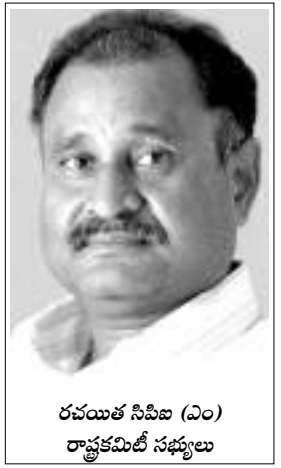
రచయిత సివిఐ (ఎం) రాష్ట్రకమిటీ సభ్యులు