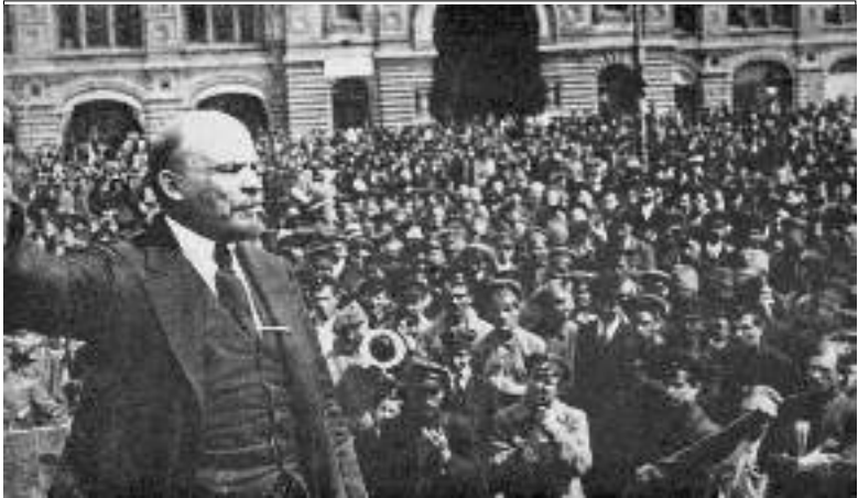
అక్టోబర్ విప్లవం లేకుండా లెనిన్ లేడు లెనిన్ లేకుండా అక్టోబర్ విప్లవం లేదు

“రష్యాలోని వివిధ మార్క్సిస్టు గ్రూపులను ఏకం చేయడం, కార్మిక వర్గంలో రాజకీయ ప్రచారం చేయడం, వారికి శిక్షణనివ్వడం, నిర్మాణం చేయడం లెనిన్ కర్తవ్యంగా ఎంచుకున్నాడు. దానికోసం ఆయన 1895లో ‘కార్మిక విమోచనా పోరాట సమితి’ పేరుతో సోషల్ డెమోక్రటిక్ సంస్థను ఏర్పరిచాడు.”