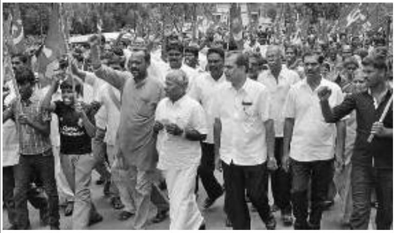
మనం చేసే ఆందోళనలన్నీ పోరాటాల కోసమే

“మనం రాసే వివేచనాత్మకం లేదా కరపత్రం లేదా పత్రికా ప్రకటన లేదా చేసే ప్రసంగానికి నిర్దిష్ట లక్ష్యం ఉన్నది. అది ప్రజలను కదిలించాలి. పోరుబాట పట్టించాలి. ఈ లక్ష్య సాధన కోసం ఎంచుకున్న ఆందోళన రూపాన్ని సద్వినియోగం చేసుకోవాలంటే తగిన కసరత్తు మీద శ్రద్ధ పెట్టాలి. లేనట్లయితే సమయం, డబ్బు, కార్యకర్తల శ్రమ వృధా అవుతుంది.”