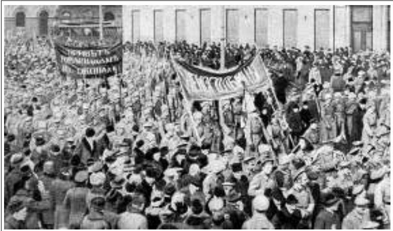
అక్టోబర్ విప్లవంలో పాల్గొన్న సైనికులకు ఆహ్వానం పలుకుతున్న రష్యన్ ప్రజలు

“విప్లవం ద్వారా ప్రభుత్వాన్ని కూలదోసి బోల్షివిక్కులు అధికారం చేపట్టడమొక్కటే మార్గమని గ్రహించాడు. సోషలిస్టు విప్లవానికి రష్యా సిద్ధంగా ఉందని చెప్పాడు. ఈ సమయంలో లెనిన్ “రాజ్యాంగ యంత్రం-విప్లవం” అనే గ్రంథాన్ని పూర్తిచేశాడు. రాజ్యాంగ యంత్రం యొక్క స్వభావాన్ని ఆయన అందులో స్పష్టం చేశాడు.”