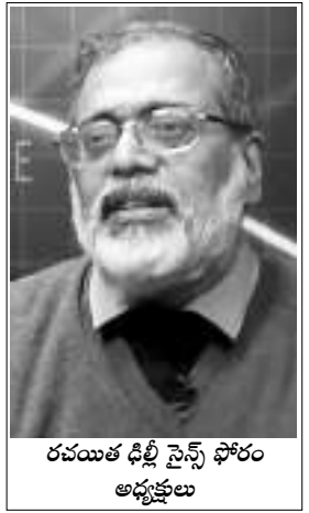
రచయిత డి.బీ. సైన్స్ ఫోరం అధ్యక్షులు

మూడు దశాబ్దాలకు పైగా అమలు జరుగుతున్న విద్యుత్ రంగ సంస్కరణల ఫలితమైన సంక్షోభం, 2003 విద్యుత్ చట్టం అనంతరం ఇంకా తీవ్రంగా మారుతున్నది. పంపిణీ కంపెనీలు విద్యుత్తుకు చెల్లింపులు చేయలేకపోవుట వలన 25,000 మెగావాట్ల సామర్థ్యం కలిగిన విద్యుత్ వృధా అవుతుందని అంచనా వేయబడింది. ఆర్థిక మంత్రిత్వశాఖ నుండి వచ్చే ఒత్తిడుల వల్ల బ్యాంకులు ప్రైవేట్ విద్యుత్ పంపిణీ చేసే కంపెనీలకు అప్పులు ఇచ్చాయి. పర్యవసానంగా భారతీయ బ్యాంకులు పరిశ్రమలకు ఇచ్చే ఋణాలలో (2015 సెప్టెంబర్ నాటికి) 22 శాతం, అంటే 5.8 లక్షల కోట్ల రూపాయలు విద్యుత్ రంగానికి ఇవ్వడం జరిగింది. ఇచ్చిన ఋణాలలో పెద్ద మొత్తం అదానీ, వేదాంత, జె.పి., జిందాల్, అంబానీలు, జి.వి.కె., టాటాలు లాంటి భారత దేశంలోని పెద్ద పెట్టుబడిదారులకు ఇవ్వబడి నాయి. ఈ ఋణాలు బ్యాంక్ భాషలో చెప్పాలంటే నాన్ పెర్ఫార్మింగ్ అసెట్స్, అంటే తిరిగి చెల్లించబడని ఋణాలుగా పరిగణించబడే అవాయంలో పడబోతున్నాయి.