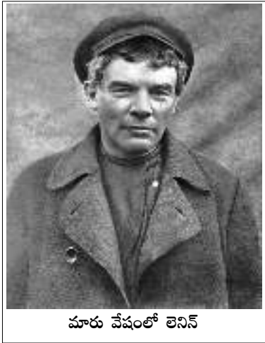
మారు వేషంలో లెనిన్

1898లో లెనిన్ ప్రవాసంలో ఉండగా రష్యన్ సోషల్ డెమోక్రటిక్ పార్టీ ప్రథమ మహాసభ జరిగింది. ఈ మహాసభ అనంతరం పార్టీలో అంతులేని సిద్ధాంత గందరగోళం ఏర్పడింది. లెనిన్ ప్రవాసం నుండి వచ్చిన తరువాత ఈ సిద్ధాంత గందరగోళానికి వ్యతిరేకంగా మార్క్సిజం ఆధారంగా తీవ్రమైన సైద్ధాంతిక పోరాటం జరిపాడు. పార్టీ పత్రిక ఇస్ట్రా ఇందులో కీలక పాత్ర వహించింది. 1903 లో జరిగిన ద్వితీయ మహాసభలో అవకాశవాద మెన్షివిక్కులకూ, విప్లవకర బోల్షివిక్కులకూ మధ్య తీవ్రమైన ఆంతరంగిక పోరాటం జరిగింది. విప్లవ పార్టీలో ఉండాల్సిన కేంద్రీకృత ప్రజాస్వామ్య నిర్మాణ సూత్రాలపై చర్చ పతాక స్థాయికి అందుకుంది. నరోద్నిక్కులపై పోరాటంలో లెనిన్ తో పాటు కృషి చేసిన ప్లెఖానోవ్ లాంటివారు కూడా ఊగిసలాటకు గురయ్యారు.