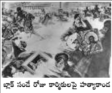
బ్లాక్ సందే రోజు కార్మికులపై హత్యాకాండ

“1907 నాటికి విప్లవ వెల్లువ పూర్తిగా అణచివేయబడింది. అయితే 1905 విప్లవం ఓడిపోలేదనీ, రానున్న విప్లవానికి రిహార్సల్గా ఉపయోగపడిందనీ లెనిన్ గుణపాఠాలు తీశాడు. తిరుగుబాటులోని విప్లవ లక్షణాన్ని ప్రశంసిస్తూనే నిర్మాణ లోపాలను ఆయన నిర్నిహమాటంగా వెల్లడించాడు.”