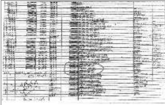
సహారా, బిర్లా గ్రూపు సంస్థలు రాజకీయపార్టీలకు (నరేంద్ర మోడీ సహా) ఇచ్చిన విరాళాలపై సుప్రీం కోర్టుకు స్పష్టమైన సంస్థ సమర్పించిన పత్రాల్లో ఒకటి

“ ఈ పత్రాల్లో దేశంలోని వివిధ పార్టీలకు చెందిన ముఖ్య రాజకీయనాయకుల పేర్లు ప్రస్తావించడమే కాదు, మోడీ, చౌహాన్, రమణ్ సింగ్, దీక్షిత్, షైనా ఎన్సి వంటి ముఖ్య నేతలకు భారీ మొత్తంలో జరిగిన చెల్లింపులకు సంబంధించి హిందీ, ఇంగ్లీషు భాషల్లో ఆయా నేతల పేర్లకు ఎదురుగా పూర్తి గణాంక వివరాలతో పదేపదే పేర్కొన్నారు.”