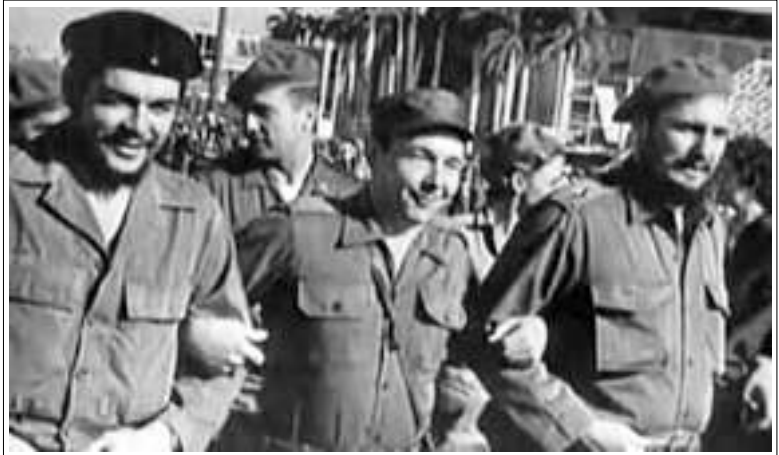
చేగువేరా, రావుల్ కాస్ట్రో, ఫైడల్ కాస్ట్రో

“క్యూబాలో విప్లవం బ్రతుకుతుందని, కొనసాగుతుందని బహుశా ఈ ప్రపంచంలో ఎవ్వరూ ఒక్కసెంటు కూడా పందెం కాసి ఉండరు. కానీ మేము సాధించాం... ఓ అద్భుతాన్ని ఆవిష్కరించాం... చైతన్యవంతమైన ప్రజానీకం, వివేకంతో, విద్యతో, సమైక్యంగా పోరాడి సాధించిన జాతీయ విజయమిది... విప్లవోద్యమమిది !”