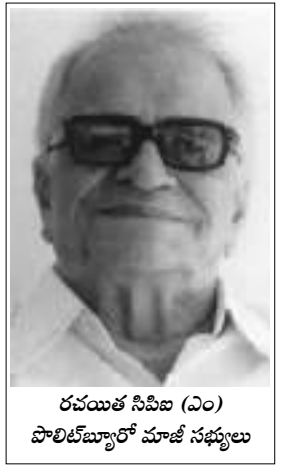
రవయిత సిపిఐ (ఎం) పొలిట్ బ్యూరో మాజీ సభ్యులు