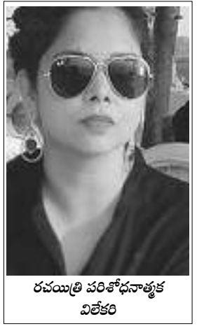
రచయిత్రి పరిశోధనాత్మక విలేకరి